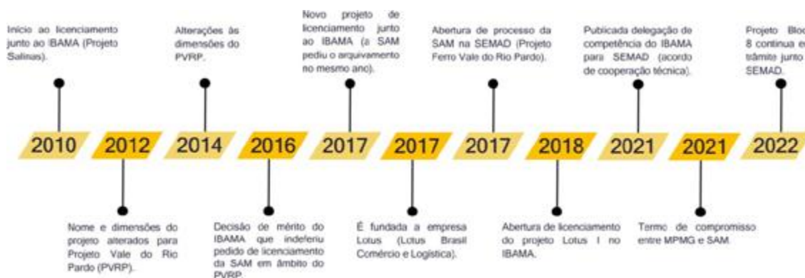
Figura 3 – Linha do tempo referente ao licenciamento do Projeto Bloco 8

O Projeto Bloco 8 é constituído por uma mina a céu aberto, uma unidade de beneficiamento, três barragens de rejeitos, três barragens de água, duas adutoras e uma linha de transmissão. O projeto é de licenciamento trifásico e classificado como classe 6, isto é, de grande porte e grande potencial poluidor. A dimensão do projeto pode ser aferida, entre outros indicadores, pelo tamanho da barragem principal de rejeitos. A barragem B1 terá 165 metros de altura e capacidade de armazenamento de 930 milhões de metros cúbicos de rejeitos. Já a barragem B2 tem capacidade de armazenamento prevista para 230 milhões de metros cúbicos de rejeitos. Em termos comparativos, a barragem Santo Antônio e a barragem Eustáquio, no município de Paracatu-MG, pertencentes à Kinross Mineração S.A., possuem, conjuntamente, a capacidade de armazenamento de 740 milhões de metros cúbicos de rejeitos.