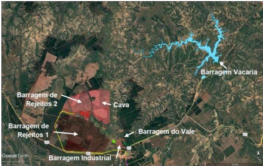
Figura 4 – Estruturas principais do Projeto Bloco 8/SAM

Desde 2021, por meio da Secretaria de Estado de Desenvolvimento Econômico (SEDE), está em elaboração o Plano Estadual da Mineração, com ações previstas até o ano de 2040. No diagnóstico realizado, há três principais “províncias portadoras de minério de ferro” no estado de Minas Gerais, assim nominadas: Quadrilátero Ferrífero, Borda Leste do Espinhaço e Distrito Ferrífero de Nova Aurora. Essas províncias correspondem aos três geossistemas ferruginosos analisados por Carmo e Kamino (2015, 2017).