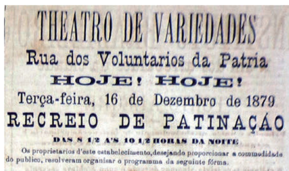
Figura 5. Anúncio do Theatro de Variedades. Figure 5. Theatro de Variedades advertisement.

A ausência de jornais de 1880 a serem consultados deixa-nos uma lacuna para entender melhor o que houve na sequência. De toda forma, pelo que conseguimos