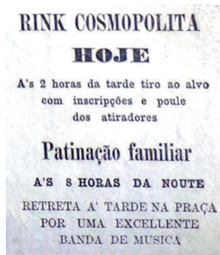
Figura 6. Anúncio do Rink Cosmopolita.

Outra interessante novidade da programação do Rink Cosmopolita foi a promoção de provas de tiro ao alvo, uma modalidade que teve grande penetração na região Sul do país, especialmente entre os imigrantes. Essas ocasiões eram acompanhadas com entusiasmo pelo público: “À diversão do tiro ao alvo, pela partida a pistola, que se anunciara entre dois dos melhores atiradores desta capital, concorreram anteontem muitos apreciadores” ( Jornal do Comércio , 14/10/1882, p. 2) (Figura 6).