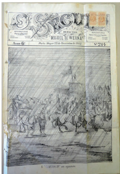
Figura 2. Jornal O Século .