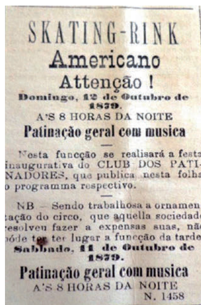
Figura 4. Anúncio do Skating-Rink Americano. Figure 4. Skating-Rink Americano advertisement.

A iniciativa não teve grande duração. Parece ter ocorrido com o Clube de Patinadores o mesmo que houve com iniciativa semelhante organizada no Rio de Janeiro (Melo, 2015) 11 . Um condicionante a ser considerado é a própria dinâmica da modalidade. Ao contrário de outras práticas, como as esportivas, na patinação não era preponderante a necessidade de existir uma agremiação. O formato empresarial dava plenamente conta de dinamizar a diversão.