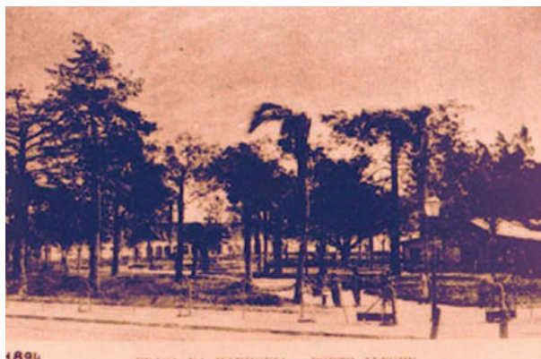
Figura 1. Praça da Harmonia, 1894.

Útil e agradável. No novo modelo de sociedade que estava se construindo na segunda metade do século XIX, no qual crescentemente se valorizavam as vivências públicas, havia certa cobrança, mais simbólica do que efetiva, de que as novas experiências conjugassem essas