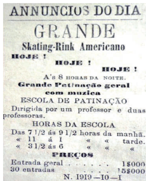
Figura 3. Anúncio do Skating-Rink Americano. Figure 3. Skating-Rink Americano advertisement.

Para aumentar o interesse do público, o estabelecimento se organizava como um centro de entretenimentos. Bandas de música animavam o ambiente. Em muitas ocasiões houve exibições de espetáculos bem elaborados, como óperas regidas por Gustavo Lindner, filho de alemão que se estabeleceu na cidade na transição dos anos 1840/1850, músico que se exibiu com frequência no Skating-Rink.