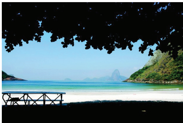
Figura 1. Vista da Praia de Imbuí.