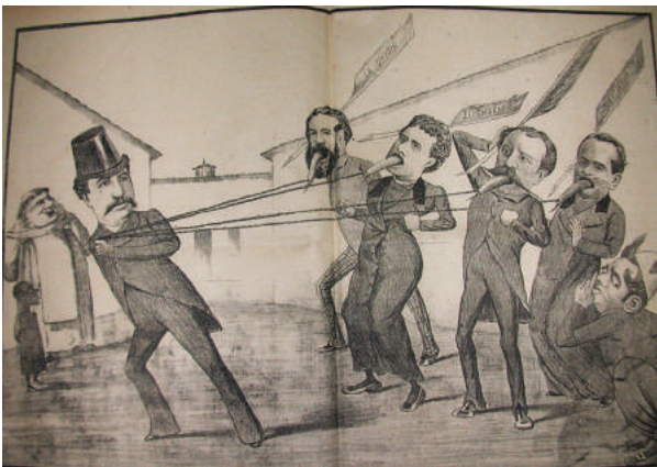
Figura 1. “Hablen, hijos de fraile”, 1886.

Este problema se aprecia desde comienzos de la década de 1880, cuando, a raíz de la Guerra del Pacífico (1879-1883), la prensa vivió un auge con la aparición de nuevos actores y el crecimiento del público. Durante esa coyuntura surgió El Ferrocarrilito , en abierta burla a El Ferrocarril , principal diario de la época y vocero de los intereses de la elite liberal. Un aspecto llamativo en la producción gráfica y textual del primero fue su preocupación constante por las formas materiales y el orden administrativo, organizacional y financiero de los “diarios grandes”, particularmente su consagrado “progenitor”.