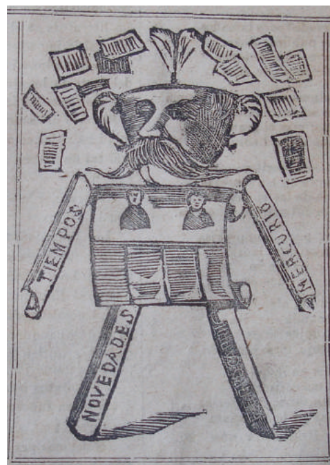
Figura 4. “Una carpa literaria”, 1880. Figure 4. “A literary tent”, 1880.