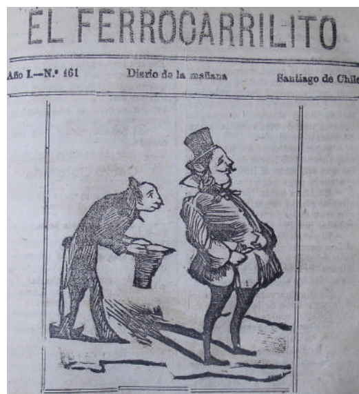
Figura 3. “ El Herald buscando suscripciones”, 1880. Figure 3. “ The Herald looking for subscriptions”, 1880.

En opinión de estos últimos, los periodistas de las publicaciones más reputadas no tenían un compromiso real con las causas que defendían. Eran una verdadera casta que trabajaba por dinero, negándose a cumplir su función social y convirtiéndose en enemigos de las