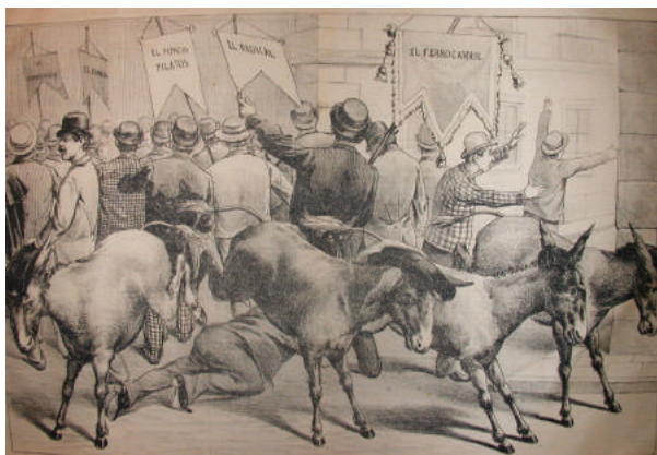
Figura 11. “Argumentos clericales”, 1893.