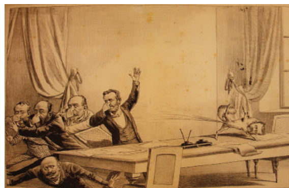
Figura 8. “El Chingue redactando El Constitucional ”, 1894.

Es posible apreciar por tanto una serie de diablillos inspirando a los redactores de El Estandarte Católico , quienes aparecen convertidos en aves de rapiña y gatos (Figura 9, El Padre Cobos , 22/08/1882, p. 2-3). De manera similar, las diatribas contra la prensa conservadora y ultramontana situaban a sus principales publicaciones ( El Chileno , El Constitucional , El Porvenir y La Unión ) azuzando el fuego y revolviendo una “piscina de odios y venganzas”, bajo la mirada atenta de un siniestro buitre