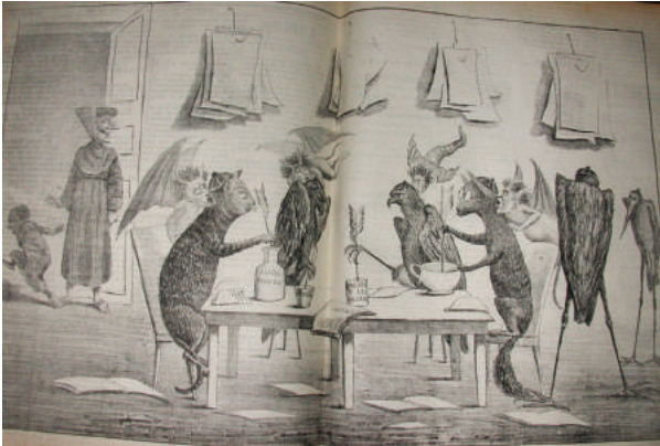
Figura 9. Dentro de la redacción de El Estandarte Católico , 1882. Figure 9. Inside the newsroom of El Estandarte Católico , 1882.