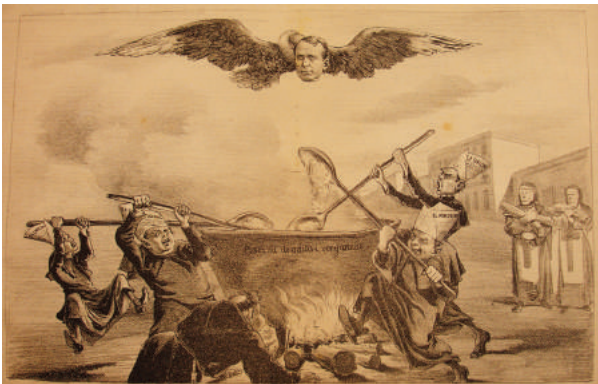
Figura 10. "Revolviendo la piscina", 1894. Figure 10. "Stirring the pool", 1894.