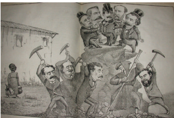
Figura 2. “La opinión minando al Olimpo”, 1882.

Figure 2. “Opinion eroding Olympus”, 1882.