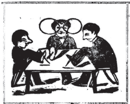
Figura 6. “Los redactores de El Heraldo en su pedestre ejercicio”, 1880.

Esta hebra argumentativa da cuenta de las pretensiones intelectuales y los egos creativos que concernían al pe-