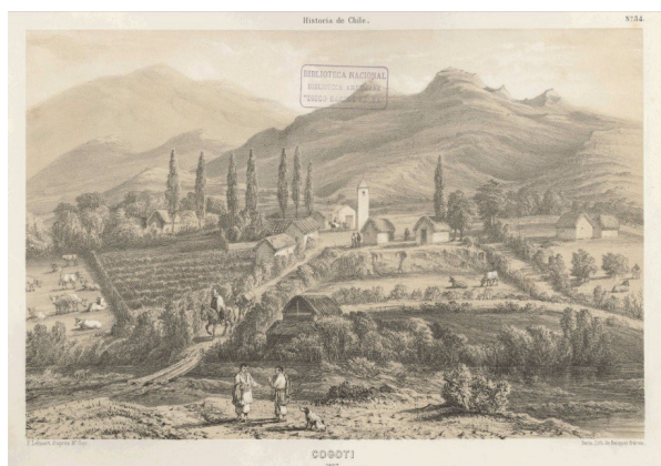
Figura 2. Cogotí, localidad de Combarbalá 1837.