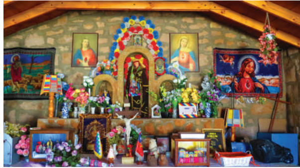
Figura 10. Vista del conjunto-altar. Figure 10. View of the altar.