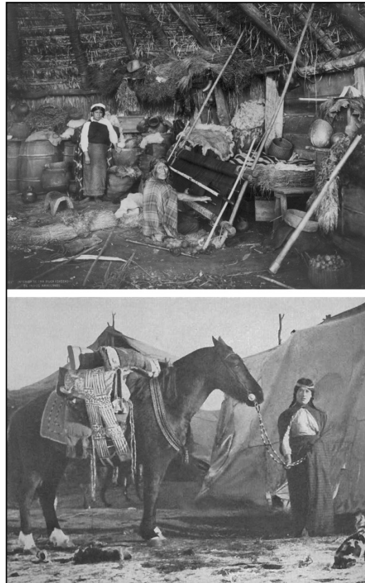
Ilustración 6. a) Vista del interior de una ruka mapuche, donde posan dos mujeres, junto a múltiples artefactos de uso cotidiano. Fotógrafo: Obder Heffer Bisset, 1890. Museo Etnográfico, Buenos Aires, Argentina. b) Mujer mapuche posando con su caballo frente a un toldo. Fotógrafo y fecha desconocida. Archivo General de la Nación, Buenos Aires, Argentina.

instrumentos musicales -erkes y kultrunes- . Así, a pesar de que la mujer era la encargada de sostener la vida doméstica, ciertos elementos y tareas parecen haber sido compartidos por ambos géneros.