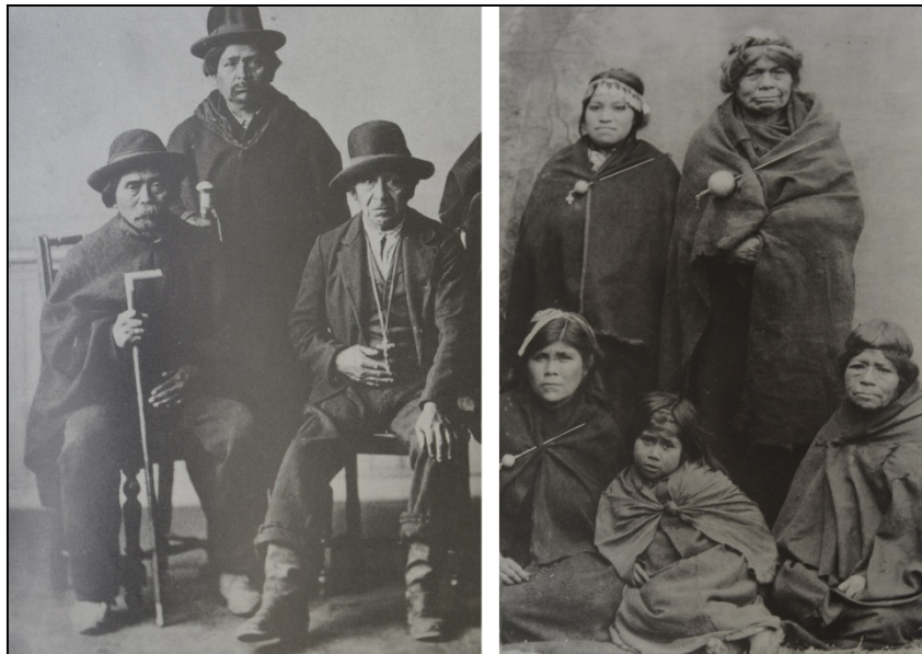
Ilustración 2. a) Varones mapuches vistiendo ropas occidentales. Fotógrafo desconocido, 1908. Museo Nacional de Historia Natural, Santiago de Chile, Chile. b) Mujeres mapuches vistiendo ropas autóctonas. Fotógrafo: Obder Heffer Bisset, 1890. Museo Nacional de Historia Natural, Santiago de Chile, Chile.

La vestimenta usada por los varones y mujeres indígenas fotografiados puede informar no solo acerca de las regulaciones de género en cada sociedad, sino también acerca de la adopción -o no- de vestimenta occidental por cada uno de los géneros. Lo primero que despierta nuestro interés es el hecho de que los individuos desnudos o casi desnudos (con cubresexo) sean varones y que casi ninguna mujer mapuche o tehuelche aparezca despojada de sus vestimentas (véanse los casos de desnudez en la página 4). Consideramos que la casi ausencia de desnudez femenina se condice con los habitus corporales (Le Breton 2010) de las mapuches y tehuelches.