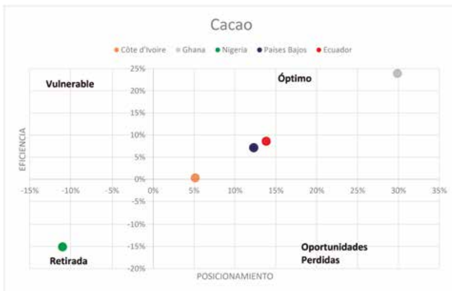
Figura 2. Indicador de modo de inserción al mercado internacional 2010-2014 (Indicador Fanjzylver). Fuente: (Trade Map , 2015). Elaborado por los autores.

En la Figura 3 se muestra como Ecuador, Kenya y Etiopía se ubican en una posición óptima del producto flores mientras que Colombia y Países Bajos en oportunidades perdidas esto se debe a que estos dos últimos países han perdido participación de mercado en los últimos años.