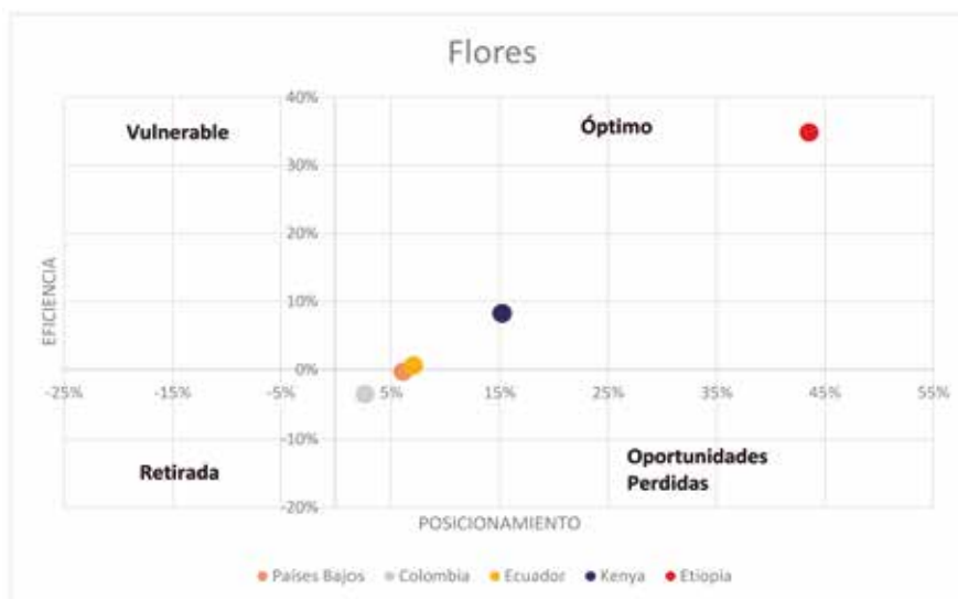
Figura 3. Indicador de modo de inserción al mercado internacional 2010-2014 (Indicador Fanjzylver). Fuente: (Trade Map , 2015). Elaborado por los autores.