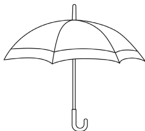
FIGURA 2. Barceló Aspeitia 2012, p. 183.

También sostiene que la figura 2 expresa la negación de la proposición “el paraguas está cerrado”, su contradictoria, en virtud de la imagen opuesta (figura 3).