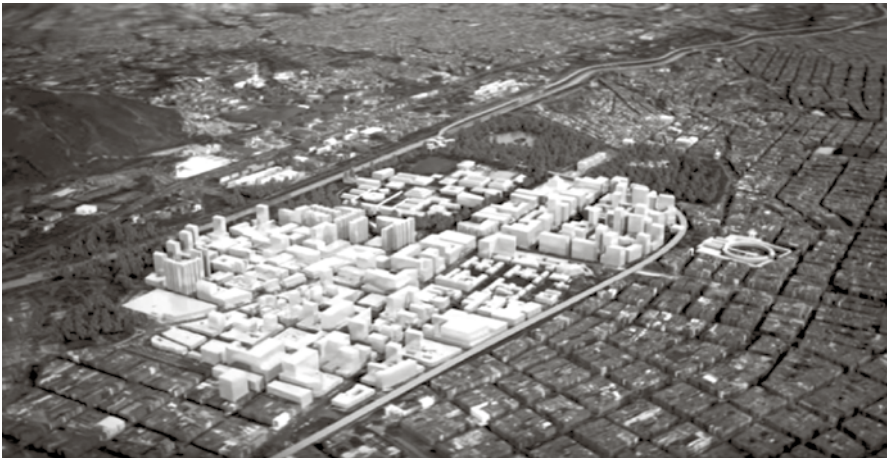
Figura 11.4 Distrito Medellíninnovation