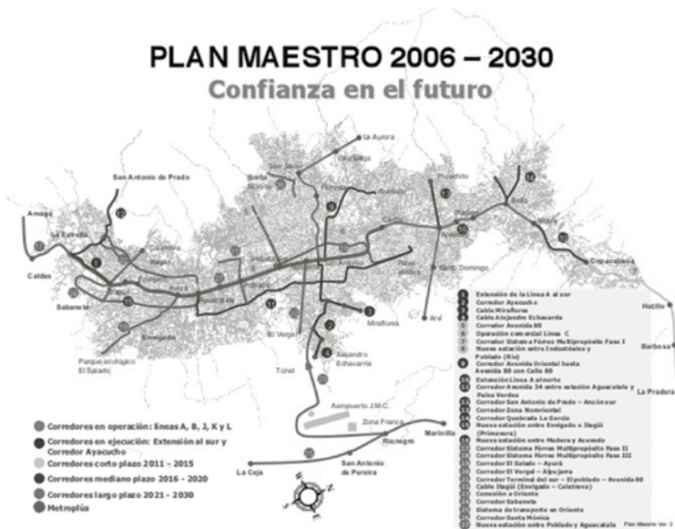
Figura 11.2 Plan maestro 2006-2030 Fuente: “Plan maestro 2006-2030” (2011).