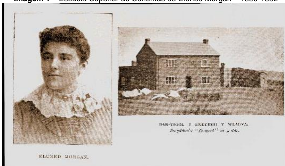
Imagem 1 – Escuela Superior de Señoritas de Eluned Morgan – 1890-1892