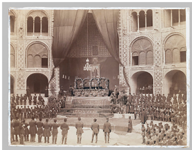
FIGURA 10. Autor desconocido. The Late Nasir al-Din Shah Lying in State in the Takiah Dawlat, One of 274 Vintage Photographs , 1896. © Brooklyn Museum, Nueva York.

Mirza Qajar retrató el paso de la comitiva fúnebre por las calles de Teherán, y el Brooklyn Museum conserva una fotografía anónima del lecho fúnebre en el Palacio del Golestán (figura 10). ❖