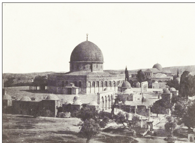
FIGURA 1. Maxime du Camp. Palestine. Jérusalem. Mosquée d'Omar , 1850.

La primera fotografía tomada en Oriente Próximo y publicada en Europa apareció en septiembre de 1851 2 en el Album Photographique de l'Artiste et de l'Amateur , del fotógrafo y editor francés Blanquart-Evrard (1802-1872), una recopilación de imágenes tomadas en Francia, Italia, Bélgica, India, Grecia y Palestina por varios autores, entre los que se encontraban Maxime du Camp (1822-1894), el barón Alexis de Lagrange (1825-1917), Louis-Alphonse de Brébisson (1798-1888) y Ernst Benecke (1817-1894), según el modelo de las Excursiones daguerrianas del óptico y editor francés Noël-Marie Paymal Lerebours (1807-1873) (Lerebours 1840). Blanquart-Evrard incluyó una fotografía de Du Camp titulada Jérusalem. Mosqué d'Omar , 1850, 3 que correspondía a una vista general de la explanada de las mezquitas de Jerusalén (figura 1).