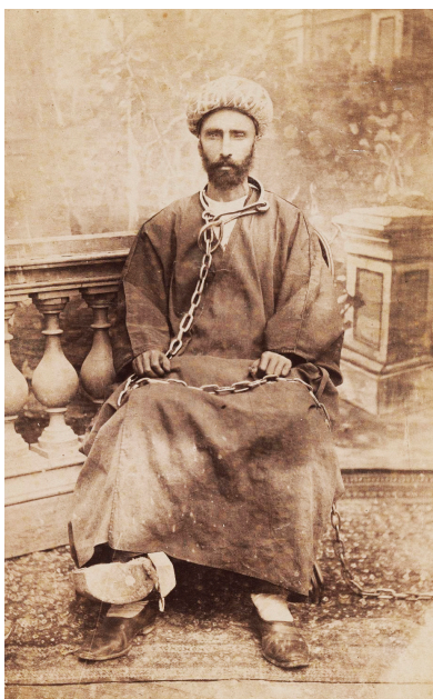
FIGURA 3. Autor desconocido. Mirza Reza Kermani (1854-1896), the Assassin of Naser al-Din Shah Qaja, 1870.

mezcla define ese sincretismo que se da en la fotografía qajar entre la tradición oriental y el interés por la estética occidental. El legado del sah para dar a conocer la fotografía fue incomparable. Al sah Naser al-Din le sucedió en el trono su hijo, el sah Mozaffar al-Din (1853-1907, r. 1896-1907), quien reinó durante 11 años. Al igual que su padre, fue un monarca muy interesado en la fotografía y, además, introdujo el cine en Irán.