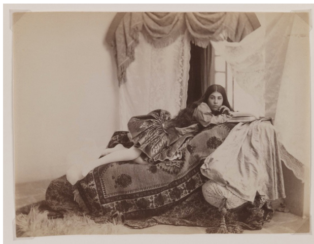
FIGURA 8. Antoin Sevruguin. Studio Shot of a Reclining Lady Reading a Book , finales del siglo XIX.

que ayudaron a definir la era Qajar en Irán, fue a través de los ojos de Sevruguin” (Scheiwiller 2018b, 145). Nació en Teherán, concretamente en la Embajada rusa, ya que su padre era un diplomático ruso de origen georgiano, aunque pasó su infancia en Akoulis y en Tiflis. Sus orígenes como fotógrafo están relacionados con el también fotógrafo georgiano Dimitri I. Yermakov (1845-1916), quien abrió un estudio en Tiflis y colaboraron juntos. En sus primeras fotografías, Sevruguin se interesó por los paisajes, los recintos arqueológicos y las gentes de Azerbaiyán, Kurdistán y Luristán. Hacia 1870 emigró a Teherán, donde abrió un estudio y desarrolló un trabajo profesional durante más de cincuenta años (Achour-Vuurman, Pérez González y Sheikh 2008), por lo que con el tiempo fue reconocido como un prominente fotógrafo. En 1897 recibió una medalla de oro en la Exposición Universal de Bruselas (Stein 1893).