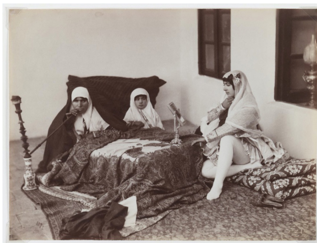
FIGURA 9. Antoin Sevruguin. Two Ladies and a Child Resting in the Harem , finales del siglo XIX.

Scheiwiller, en sus investigaciones acerca de la figura de Sevruguin, destaca que “los académicos lo han identificado y descrito de varias maneras que afectan nuestras interpretaciones de él y de su obra, como llamarlo ‘occidental’, ‘orientalista’, ‘ruso’, ‘georgiano’, ‘armenio’, ‘iraní’, o una combinación de dos o más” (Scheiwiller 2018b, 145). En consecuencia, la obra fotográfica de Sevruguin supone un compendio de todos esos calificativos y, por extensión, un fiel retrato de la sociedad iraní de finales del siglo XIX y principios del XX, en ese basculamiento entre tradición y modernidad, que ofrece una gran variedad de tipos populares y representantes de los estratos de la sociedad.