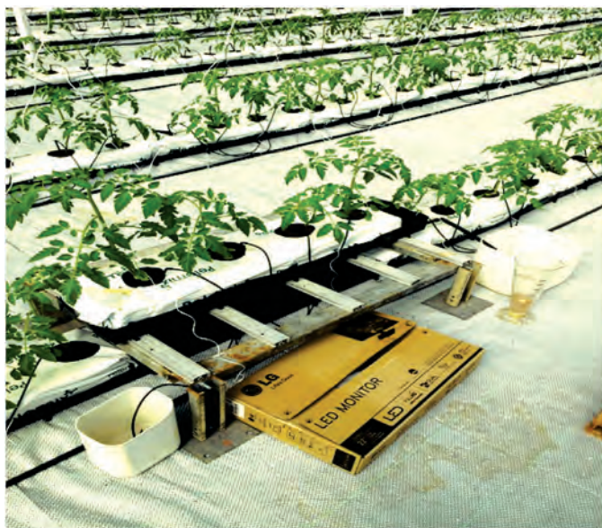
FIGURA 2. Punto de control.

coco o pelemix, para recoger en dos recipientes el agua de la solución de aporte en uno y la de la solución de drenaje en otro, como se representa en la Figura 2.