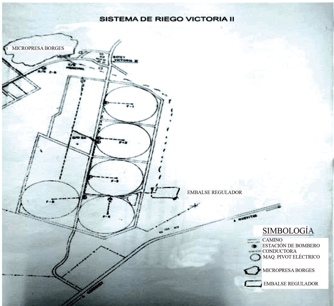
FIGURA 2. Disposición de los sistemas de riego UBPC Victoria II.