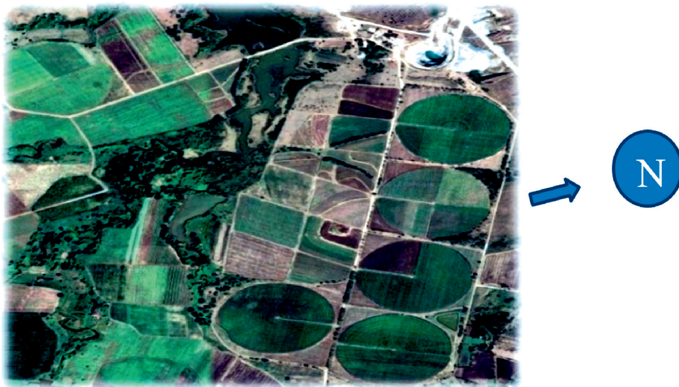
FIGURA 1. Imagen satelital UBPC Victoria II

La investigación se desarrolló durante el periodo comprendido entre los años 2016 – 2017, en áreas de la Unidad Básica de Producción Cooperativa (UBPC) “Victoria II”, perteneciente a la Empresa Agropecuaria Camagüey, la que se encuentra ubicada geográficamente en el municipio Camagüey, entre las coordenadas N (310.00-315.00) y E (403.00- 408.00) en la hoja cartográfica San Serapio (4680-II-A) a escala 1:25 000, limitando al norte con el polígono militar Lesca, al sur con la carretera de Nuevitas, al este con el camino a la pollera La Lucha y al oeste con la Granja Estatal de Nuevo Tipo (GENT) Victoria I (Figural).