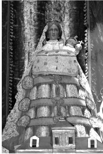
FIGURA 5. Escultura de la virgen de Loreto (ca. 1737), escultura de bastidor, talla italiana, santa Casa de Loreto, San Miguel de Allende, Guanajuato. Fotografía: EGL, 2014.

La factura de la escultura de bastidor es de origen italiano. Según se comenta por tradición, ésta llegó a la villa después de la muerte de ambos condes, en 1749, por lo que fue su hijo José María Loreto de la Canal quien la recibió. Al igual que la lauretana que encargaron los jesuitas Zappa y Salvatierra, únicamente se enviaron las manos y la cabeza de la Virgen y su hijo, a la espera de ser acabada por imagineros novohispanos (Fig. 5). Esta