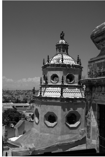
FIGURA 2. Cúpula del camarín de la santa casa de Loreto, San Miguel de Allende, Guanajuato.

contaban con yeserías que cubrían de piso a techo las paredes, aunque en la de San Miguel esto fue suprimido. Una característica primordial de estos espacios es la cúpula del camarín que, vista desde su exterior, aparenta una tiara papal ceñida por tres coronas. Tanto la morfología del espacio como su iconografía fueron planeadas para la alabanza y exaltación de la virgen María, por lo que en sus elementos estructurales y ornamentales existen referencias marianas (Figs. 1 y 2). Ejemplos de esta tipología de casa-capilla, aún se pueden encontrar en Guadalajara y San Luis Potosí.