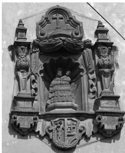
FIGURA 3. Virgen de Loreto con escudo de armas. San Miguel de Allende, Guanajuato.

a los 28 000.00 pesos, fincados en inmuebles que incluían las haciendas de Calderón, de Cueramabaro, de Don Diego y de Rincón y la labor de Tirado, en ganado mayor y menor así como de carga y tiro, en particular se destinaban 2 800.00 pesos anuales para los gastos corrientes de la liturgia en la capilla. 18