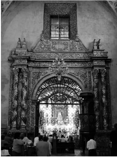
FIGURA 1. Portada de la santa casa de Loreto, San Miguel de Allende, Guanajuato. Fotografía: Erika González León (EGL), 2014.