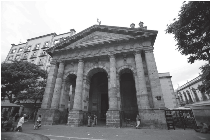
Restos del Colegio de Santo Tomás, 2017.