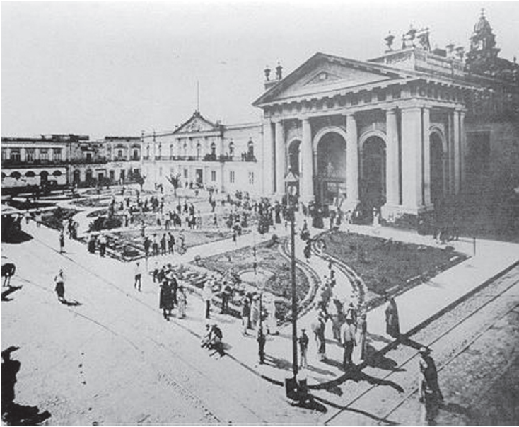
Antiguo Colegio de Santo Tomás, México, Fototeca Digital, Fondo: Parques y Jardines, 1886, imagen 001.