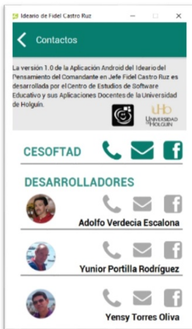
FIGURA 9 Contactos