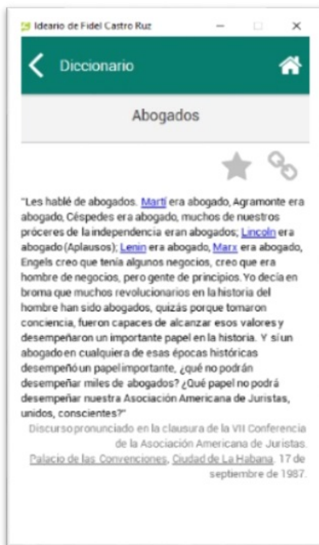
FIGURA 5 Visor del contenido de una idea