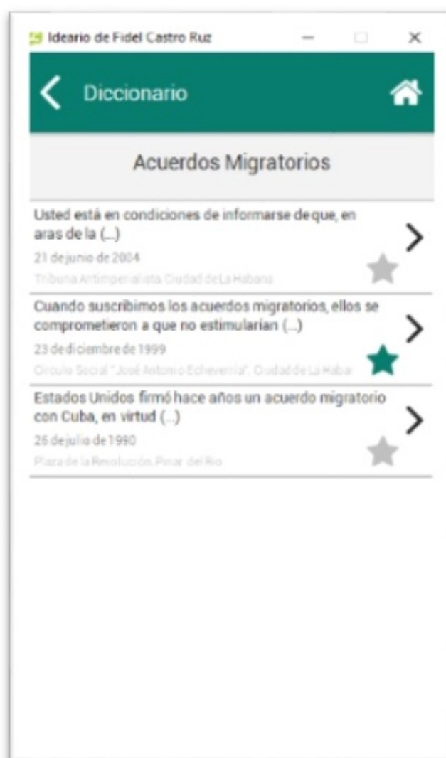
FIGURA 4 Visor de ideas