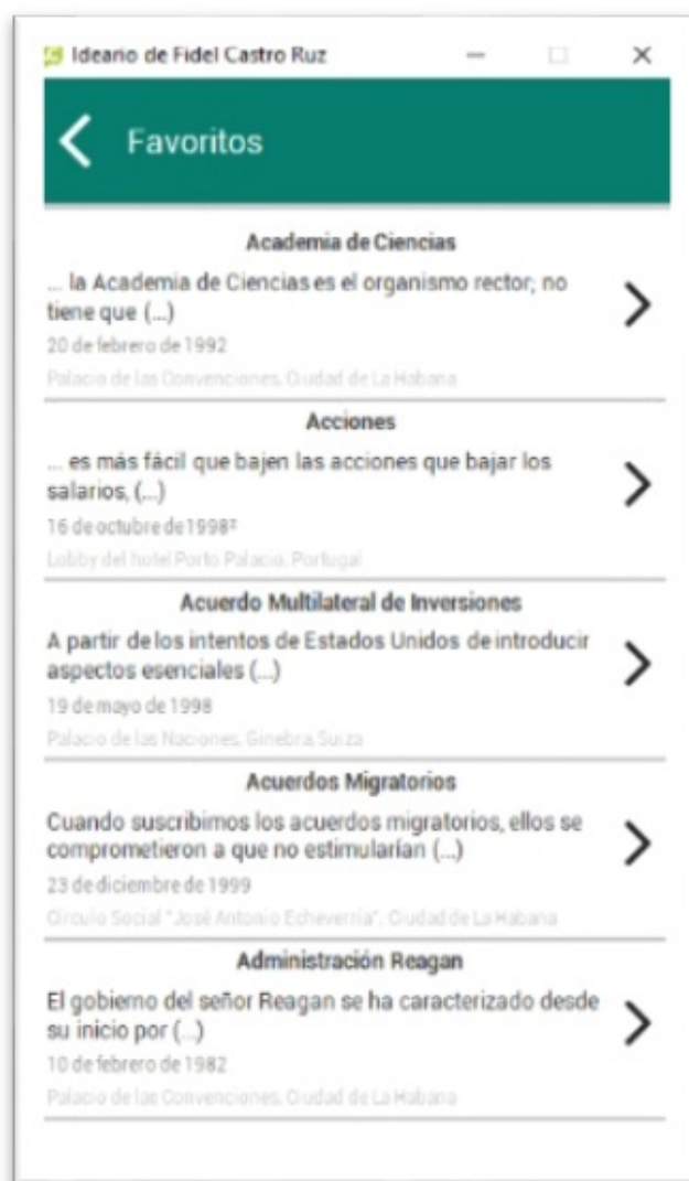
FIGURA 7 Sección de Favoritos