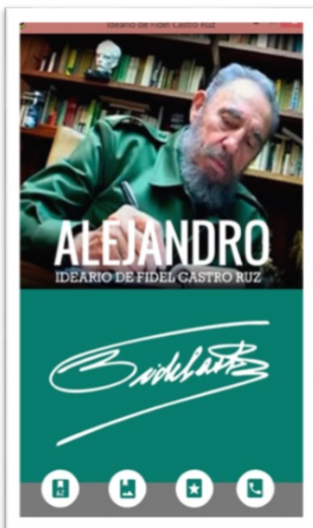
FIGURA 2 Pantalla principal