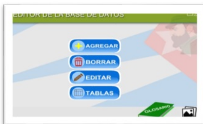
FIGURA 10 Pantalla inicial de la herramienta

Figura. 10: Pantalla inicial de la herramienta