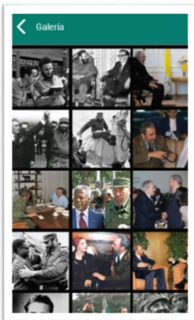
FIGURA 8 Galería de fotos