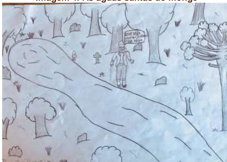
Imagem 4: As águas santas do monge