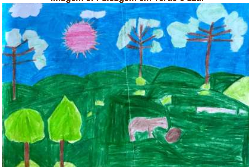
Imagem 3: Paisagem em verde e azul