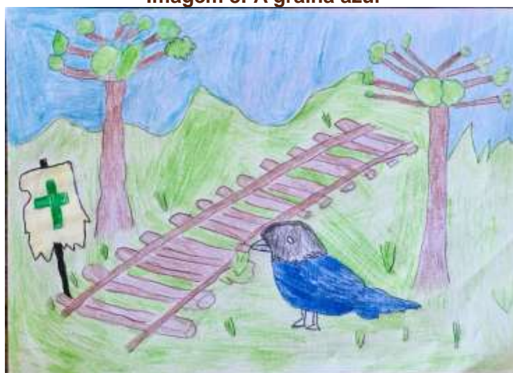
Imagem 8: A galha azul