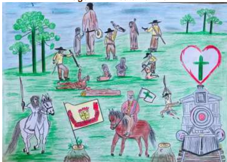
Imagem 7: A batalha final