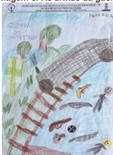
Imagem 6: As armas da guerra