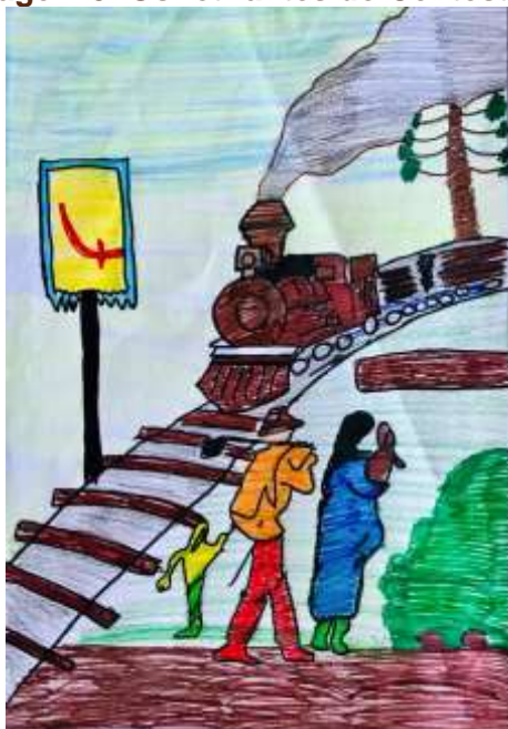
Imagem 5: Os retirantes do Contestado