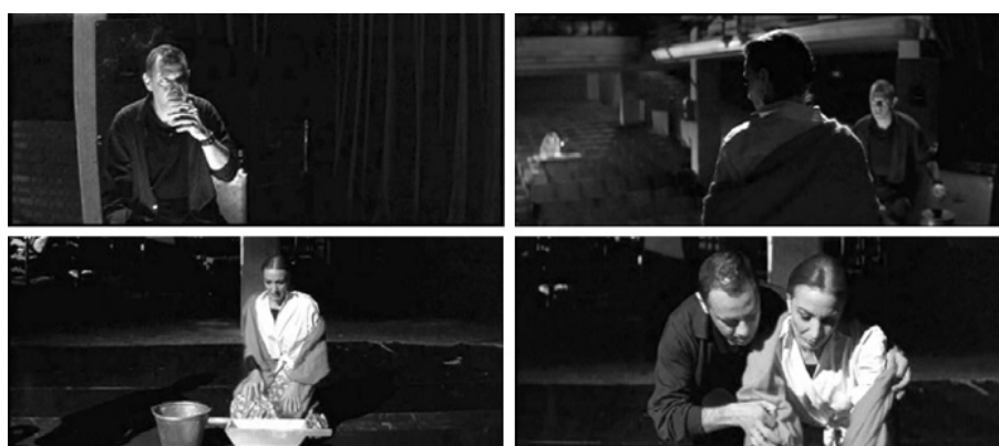
Figuras 21, 22, 23 y 24