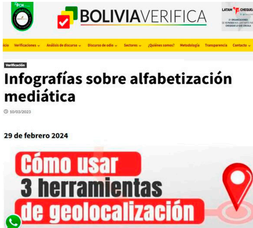
Imagen 4. Infografía divulgativa en Bolivia Verifica