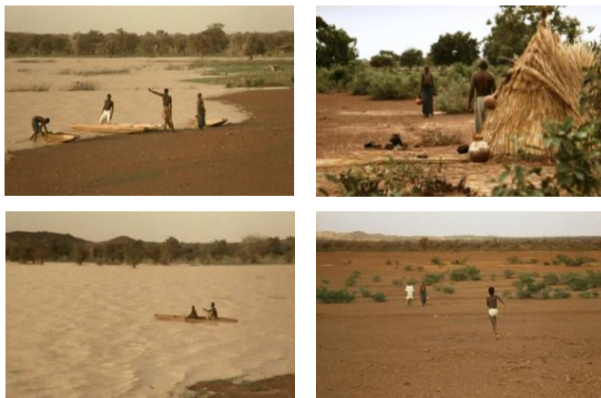
Imágenes 26-29. Sana buscando el curandero y el medicamento, muy lejos del pueblo: improbable coincidencia del ir y venir. Fuente: Ouedraogo, Idrissa, 1989.

En el caso 2 (imágenes 26-29), podríamos considerar el largo viaje de Sana en busca de un curandero y de un tratamiento para la enfermedad de Nopoko que atraviesa colinas y la sabana, tomando una barca para atravesar un lago, y regresa con el curandero por un camino que no se parece en nada al anterior.