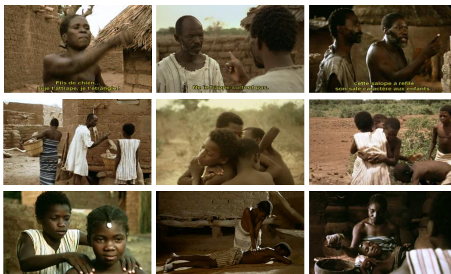
Imágenes 1-9. Gestualidad de las interacciones en el pueblo: mandatos, amenazas, ataques y defensa, masajes y cuidados. Fuente: Ouedraogo, Idrissa, 1989.

interacción, las personas se sacuden, se tocan, se golpean, se acarician o se dan masajes. Nada muy original, al parecer, aparte del carácter sistemático de estos contactos 4 y de su preeminencia sobre los intercambios verbales: tanto si una conversación se capta en un primer plano como en un plano amplio a distancia, tanto si podemos oír el diálogo como si no, las interacciones gestuales bastan. La gestualidad de órdenes, prohibición, indicación, amenaza o afecto parecen carecer de especificidad. Sin embargo, hay una: todas las interacciones que acabamos de comentar, con una gestualidad codificada y estrictamente ligada a situaciones interindividuales y actos estereotipados, tienen lugar dentro de los muros de la aldea, o cerca de ella, en una choza o en la maleza; además, casi sistemáticamente tienen lugar allí, bajo la mirada del otro.