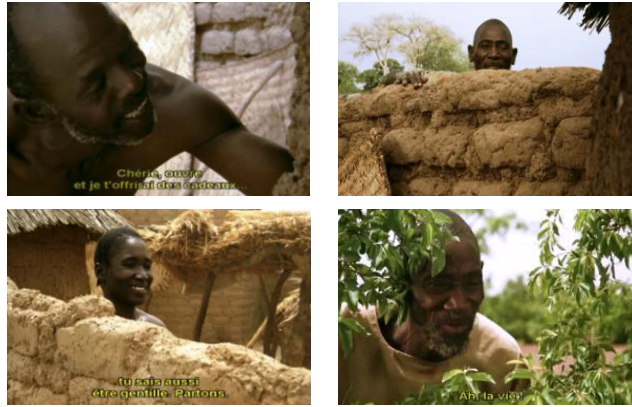
Imágenes 10-13. Contacto visual, control social y reflexividad interna e íntima en el pueblo y sus alrededores bajo la mirada de los demás, las interacciones corporales son la “vida” misma.

previsible que tenga que compartir el espectáculo con uno de los miembros de la aldea, al que descubre en un plano recortado (imágenes 10-13) al final de la secuencia. 5 Además, este desdoblamiento del observador introduce un juicio (a través de la expresión facial del aldeano observador: enfadado, hostil, sonriente, benévolo, a veces incluso duplicado por un comentario verbal) que influye necesariamente en la mirada del espectador, obligándolo al menos a tomar posición, si no a adoptar ese mismo juicio.