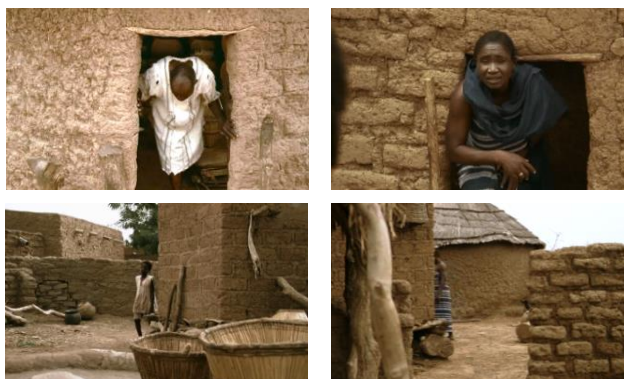
Imágenes 14-17. Limitaciones espaciales, pasajes angostos, congestiones y barreras.

En cambio, en el monte, la gestualidad ya no está codificada; son inventivos, libres, imprevisibles, incluso poéticos, sobre todo en Yaaba : brincos, piruetas, intercambios de sonrisas a distancia, paseos de la mano, caminatas y carreras en solitario o en pareja, encuentros y saludos, negociaciones para un desplazamiento en piragua o en burro. Las velocidades y los ritmos de los movimientos de cada uno son diferentes y están fuertemente contrastados: la carrera espontánea y caprichosa de Bila, el lento caminar de Sana o Nogma, los galopes de los jinetes que atraviesan el campo, los suaves trotes de los burros... cada movimiento expresa una acomodación entre el vigor de los cuerpos, la resistencia de los lugares, el tema de la práctica en curso y la naturaleza del objetivo perseguido. Además, esta gestualidad y estas interacciones no escapan, la mayoría de las veces, a la estrecha vigilancia de los demás actores, en particular de los adultos que vigilan a los niños. Se eliminan todas las limitaciones.