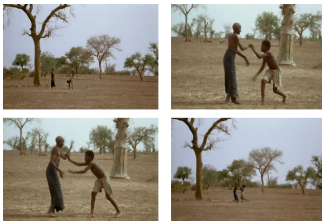
Imágenes 18-21. Bila y su abuela: juegos de manos, inventiva y coreografías corporales. Fuente: Ouedraogo, Idrissa, 1989.

agua o fuego— y con las líneas estructurantes del espacio recorrido. El espacio abierto del monte ofrece así a las interacciones corporales no sólo libertad y posibilidades creativas y estéticas, sino también una extensión a todos los elementos que componen el entorno en el que se despliegan, el entorno de los actores humanos.