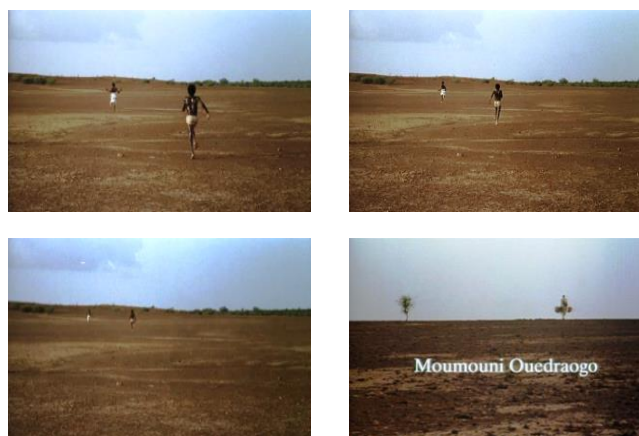
Imágenes 22-25. Partir o regresar en el eje de la profundidad.

En el caso 1, en Yaaba , en los planos de apertura y de cierre, los dos niños, Bila y Nopoko, corren juntos hacia las profundidades, lejos de la aldea (imágenes 22-25): van en busca de otro mundo, aún desconocido, y experimentan los juegos de la infancia como la apertura a una vida adulta en una zona utópica aún por determinar.