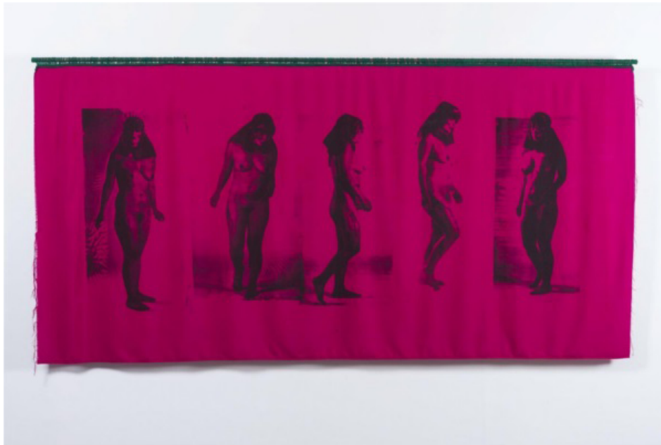
Figura 2: Foto exhibición: “La señorita”, serigrafía sobre paño femenino Misak, 2017.