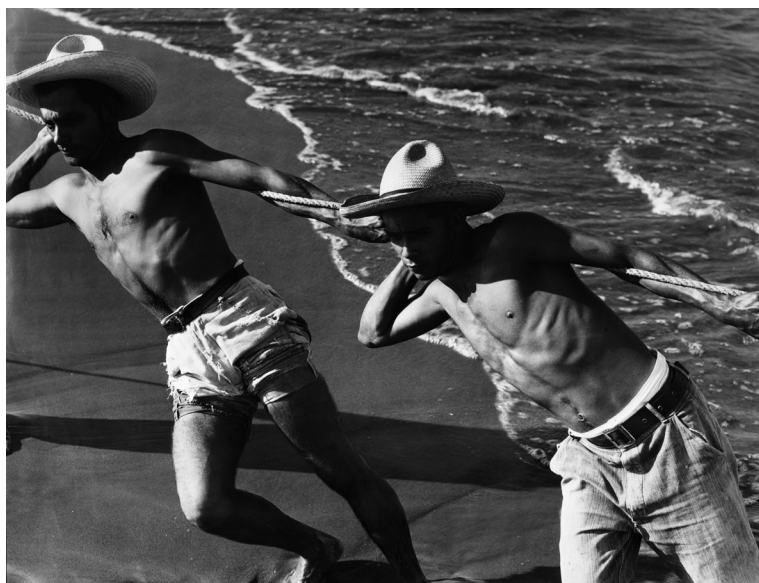
dos pescadores tirando de una red. 47