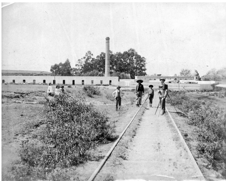
El Valor, ca. 1926.

tenían habilidades hasta entonces desconocidas en México. Como testifica el caso de Sudek, los empleadores usaban las redes sociales para atraer tales especialistas a sus fábricas.