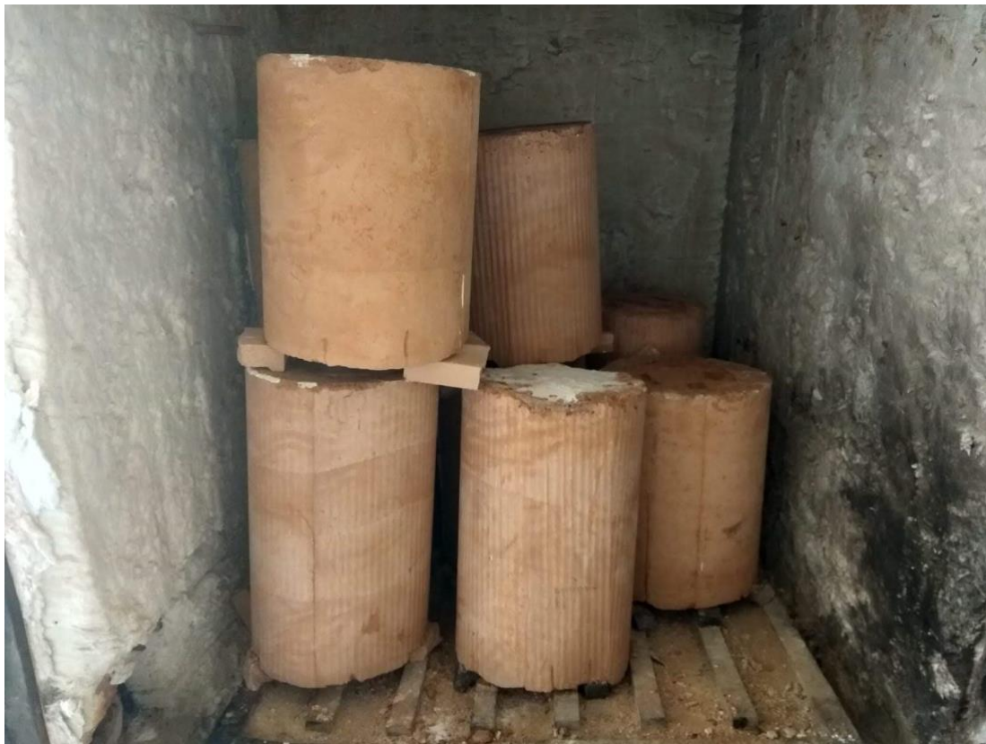
Fig 4. Moldes de Chamota en la Actualidad, 2018.