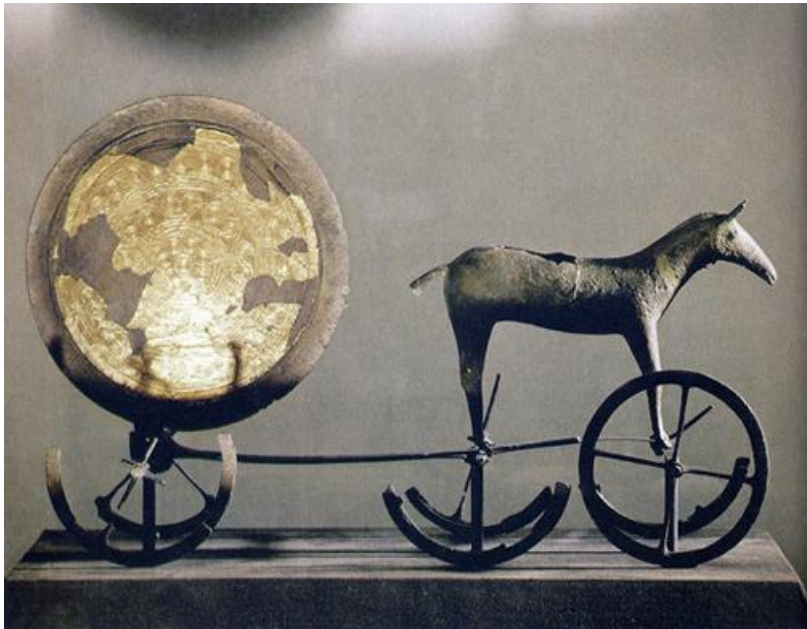
Fig.1. El Carro Solar deTrundholm.

Dinamarca. Por encima de esta incógnita, sin embargo, queda la certeza de que el carro de Trundholm requirió las manos más expertas, el taller de mejor reputación, por aspirar a un fin superior, por servir a una causa suprema...” 252