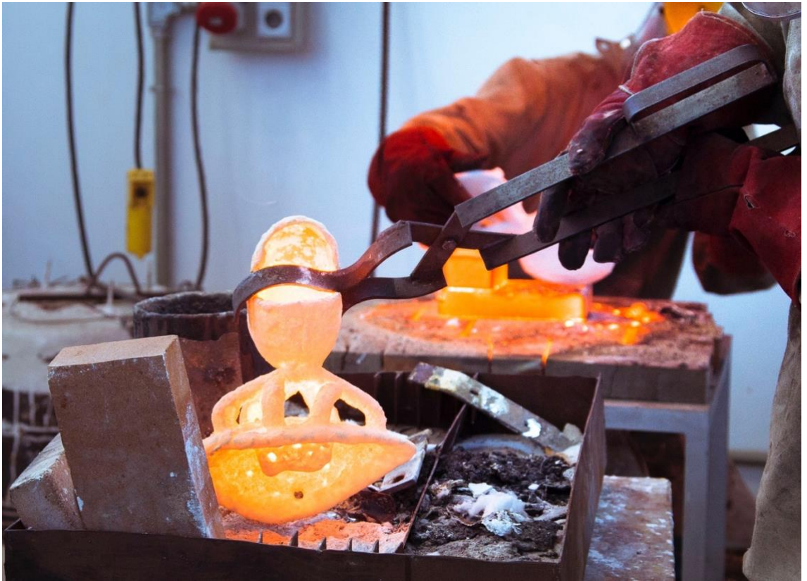
Fig. 8.- Microfusión por volteo.

dominar la acción, ya que se puede ver el momento de la fusión del metal. Si es verdad que en el crisol totalmente cerrado no existe la oxidación del metal, por lo tanto se aprovecha la totalidad del metal, en cambio en el crisol semicerrado si entra parte de la oxidación y el metal se recuperacasi todo, la escoria queda en la superficie al hacer la maniobra del volteo manual y no entra dentro de la cavidad de la pieza.