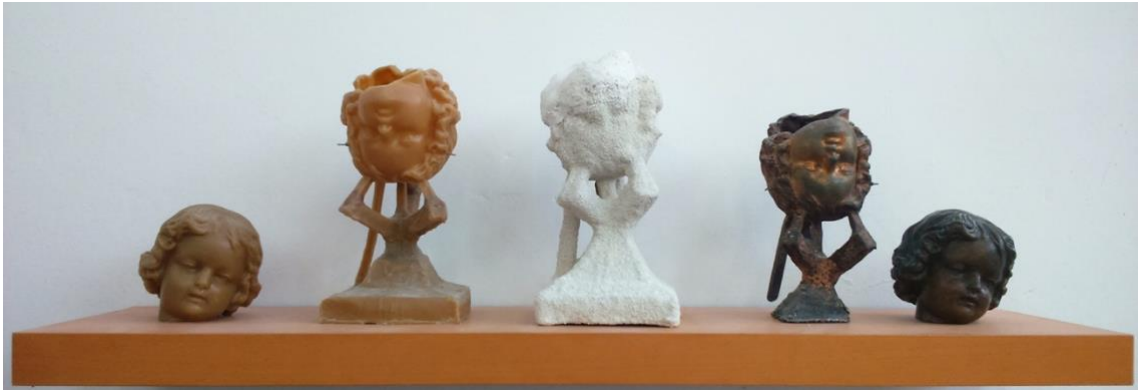
Fig. 7: Secuencia procesual de la fundición a la cera perdida, molde de Cascarilla cerámica.

Una de las características más importantes del molde de cascarilla cerámica es su forma, que se adapta a la del modelo a reproducir delimitando su contorno. Esto hace posible reconocer un molde a simple vista y nos permite realizar cualquier forma por más compleja que sea. Evita problemas ya que podemos observar la pieza en su totalidad para evaluarla detalladamente y corroborar que no hay errores ni fisuras que pueda acarrear mayores problemas durante el proceso, ya sea desde el comienzo de elaboración del molde en cada una de sus capas como durante el descere, cocción y colada del metal, que es el momento límite que verifica la resistencia del molde y evidencia sus puntos más débiles.