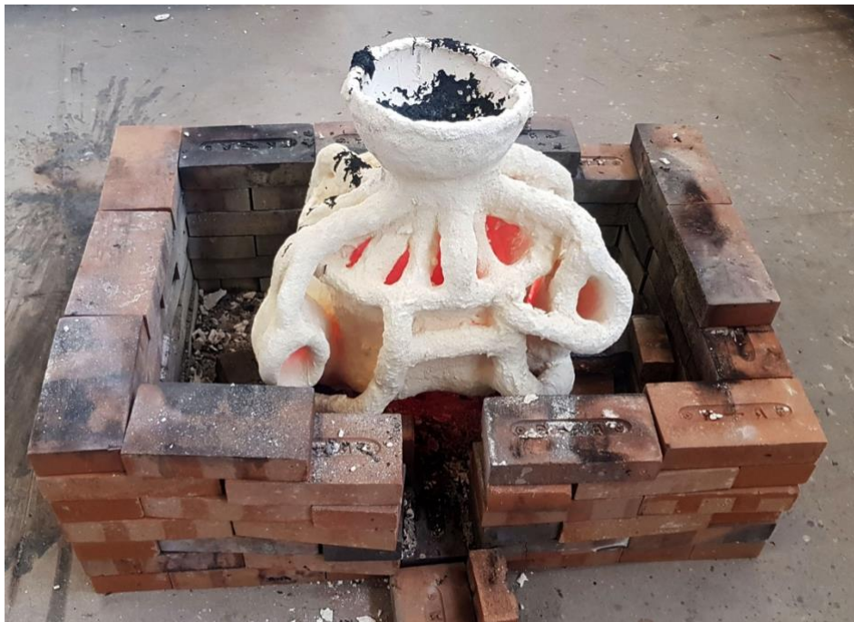
Fig. 6.- Molde de cascarilla cerámica tras la colada.