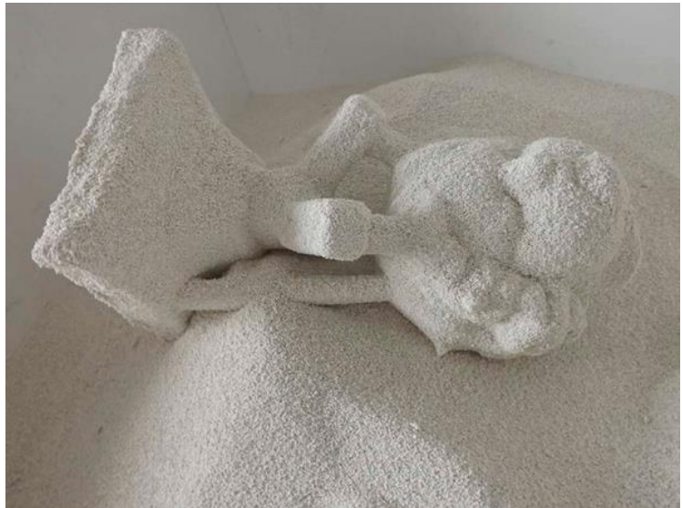
Fig. 5: Proceso molde de Cascarilla cerámica. Fuente: Autoriade la investigación.

El sílice y la alternación de la moloquita son las implicadas en el grado de porosidad. Cuando más aglutinante menos poroso es y más rígido, por lo tanto, se debe buscar un equilibrio entre porosidad y resistencia. Ambos componentes conformarán una papilla que aplicaremos sobre el modelo de cera y a la que le proyectaremos, normalmente, manualmente grano del mismo material refractario alternando diferentes granulometrías aportando, como indicábamos, porosidad y resistencia al molde.