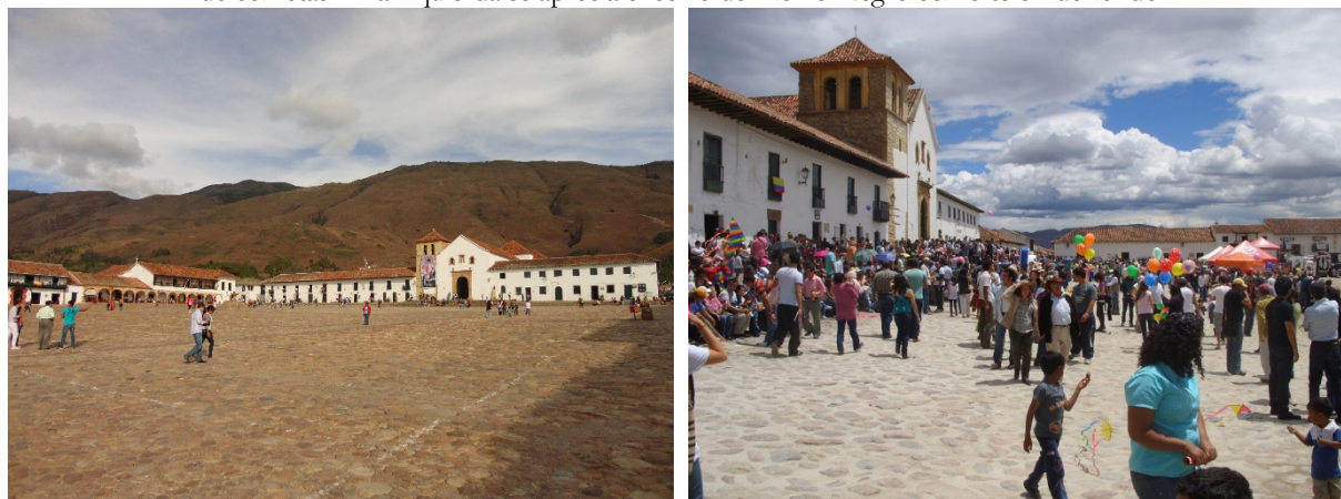
Figura 4 - Comparativo de la plaza mayor de Villa de Leyva en un día sin afluencia de público vs. un día de festival de cometas. A la izquierda se aprecia el cerro de Morro Negro como telón de fondo

El escenario principal de los eventos es la plaza mayor, el espacio en el que es más notorio el impacto de la actividad turística, y los espacios