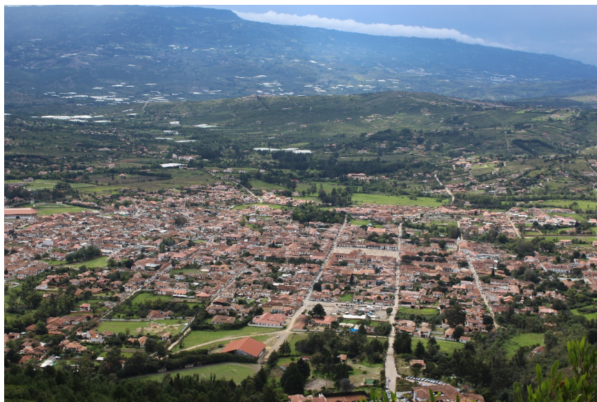
Figura 2 - Vista general del casco urbano de Villa de Leyva desde el cerro de Morro Negro

Esta renombrada vocación turística de Villa de Leyva genera la afluencia masiva de visitantes en ciertas épocas del año, ocasiones en las cuales se pone a prueba la infraestructura del centro histórico, sometido a los riesgos que trae consigo el turismo de masas pero que sin embargo se convierte para muchos habitantes del municipio y de la región en escenario que brinda la oportunidad de obtener ingresos económicos. Es en este punto en donde surge el conflicto entre la protección del patrimonio cultural inmueble y la actividad que en las últimas décadas le ha dado reconocimiento a la población.