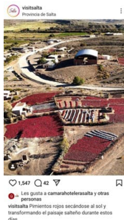
Figura 3 – Promoción de producción de pimientos en Valles Calchaquíes