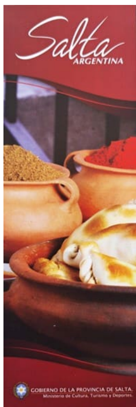
Figura 2 – Promoción turística oficial de la gastronomía salteña

Fuente: Ministerio de Turismo y Deportes de Salta. Material entregado en la vía pública en 2019.