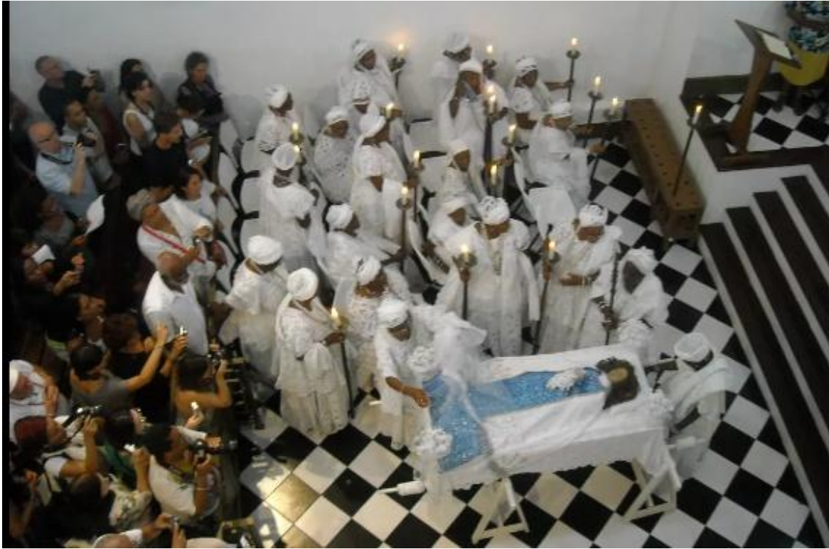
Legenda: As imagens apresentadas correspondem: (1) Missa com Irmãs; (2) Cortejo com as Irmãs; (3) Trabalho com o tabaco; (4) Memórias de lutas no devir e (5) Missa com corpo da Virgem.