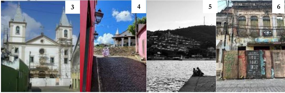
Legenda: As imagens apresentadas correspondem: (1) Conjunto do Carmo; (2) Casa de Câmara e Cadeia; (3) Igreja Matriz; (4) Igreja D'Ajuda; (5) Rio Paraguaçu e São Félix e (6) Casario em Cachoeira.