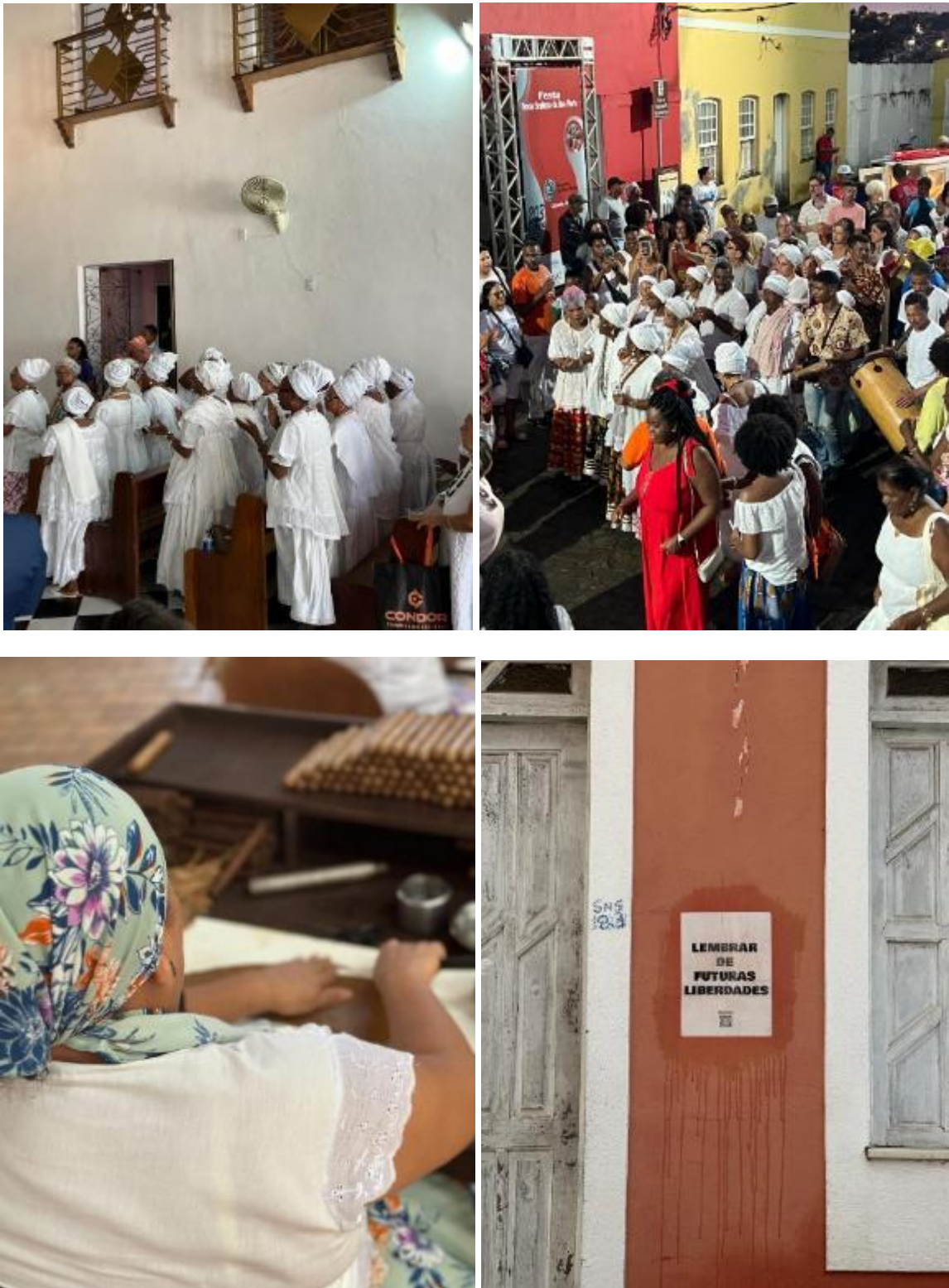
Figura 5 – Imagens, em Cachoeira, relacionadas à Irmandade da Boa Morte