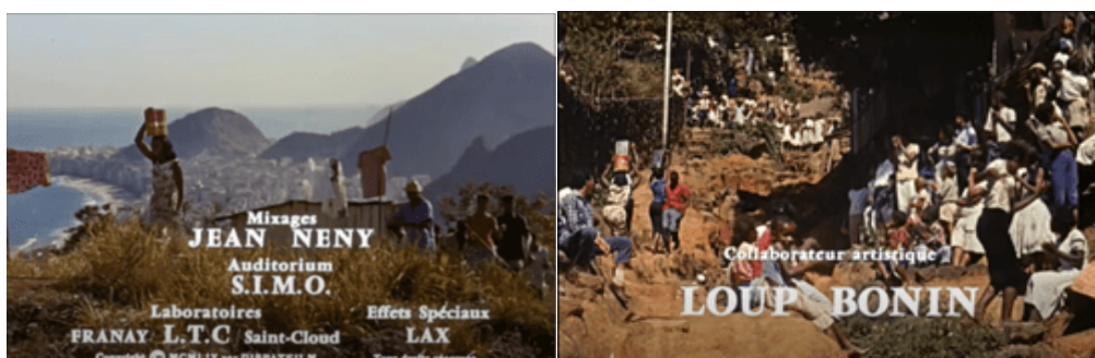
Figura 2 – Captura de tela de Orfeu do Carnaval