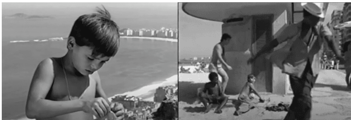
Figura 3 – Captura de tela de Fábula