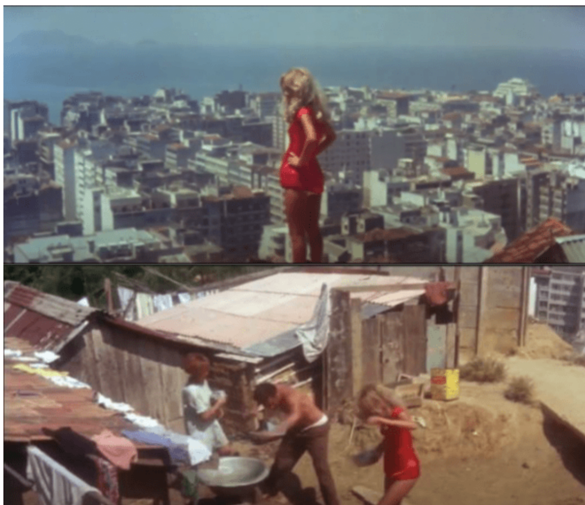
Figura 4 – Captura de tela de Copacabana Mon Amour