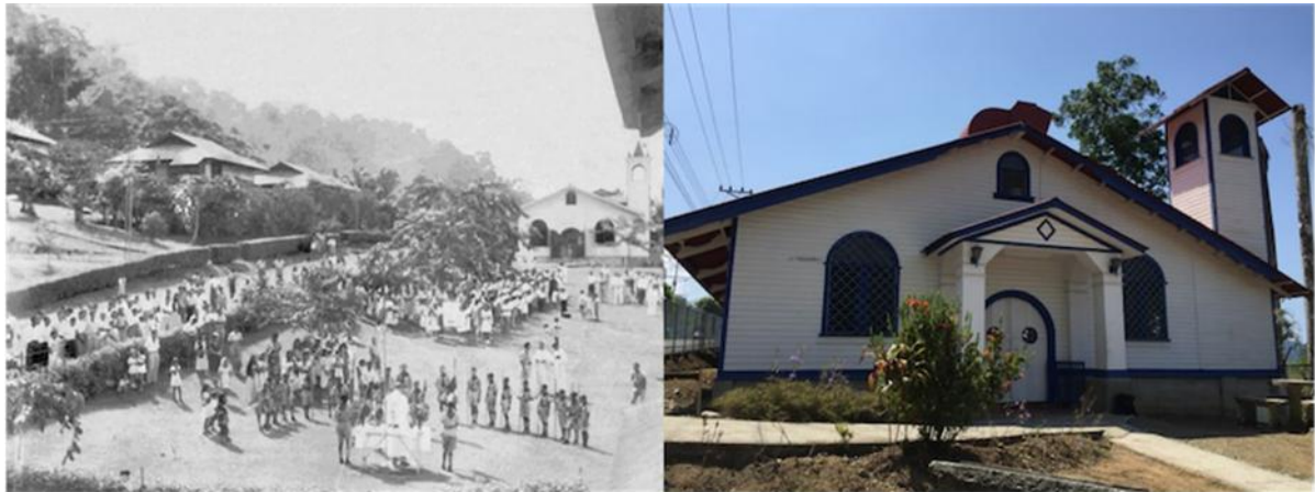
Figura 9 Templo Católico San José, Golfito.