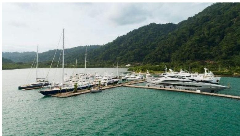
Figura 5 Proyecto Marina Bahía Golfito.