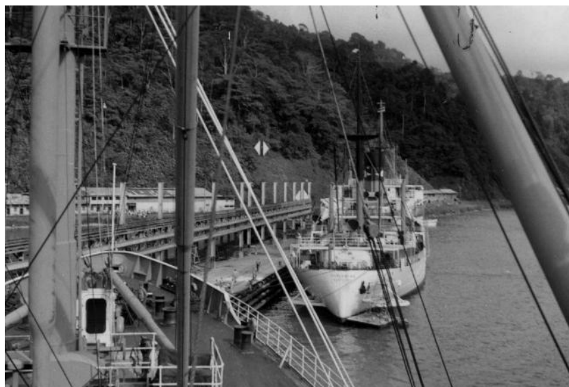
Figura 3 Muelle de Golfito en operación s.f.