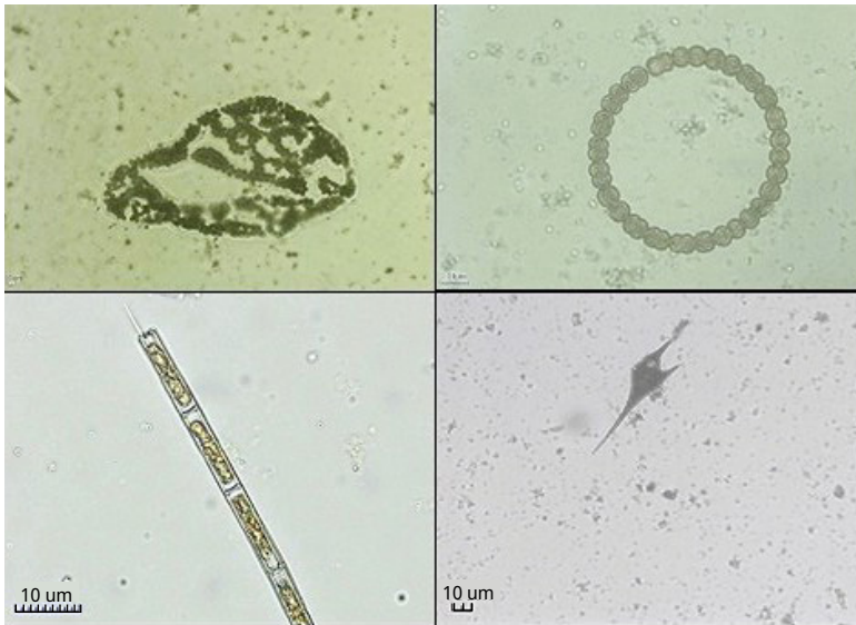
FIGURA 2. Imágenes de algunos organismos del fitoplancton formadores de floraciones en el embalse de Salto Grande. Microcystis wesenbergii (10x), Dolichospermum circinale (10x); Aulacoseira granulata (10x) y Ceratium furcoides (10x).

muestras del embalse de Salto Grande; de los cuales 10 pertenecen a Cyanobacteria, 7 a Bacillariophyceae, 9 a Chlorophyceae, 2 a Dinophyceae, 1 a Euglenophyceae, 1 a Cryptophyceae y 1 a Chrysophyceae.