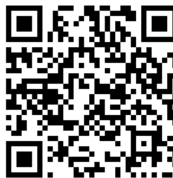
Figura 5. Código QR del video aprendiendo guitarra con las TIC, generado en la página https://www.codigos-qr.com/generador-de-codigos-qr/