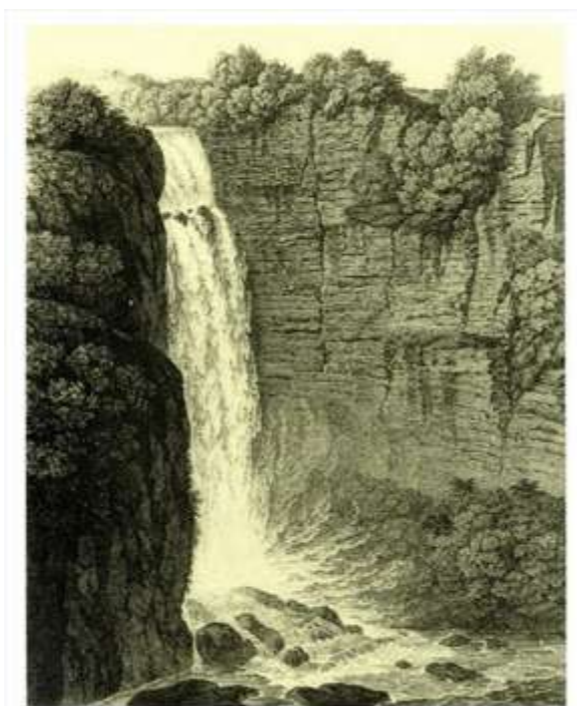
Figura 1. Salto del Tequendama, Cundinamarca, Colombia (1803).

encontrarlo en Alexander Von Humboldt quien, exaltando la belleza natural de un lugar, el salto del Tequendama en Cundinamarca, Colombia, el cual le dejaba “las más hondas impresiones en el alma” (ver fig. 1), reprochaba a las cataratas del Niágara no ser lo suficientemente bellas, “pintorescas”, por no tener la altura ni la cantidad de agua en relación proporcional y por estar situadas en la zona boreal, lo que las hacía carecer de flora herbácea, palmas y heliconias. 12