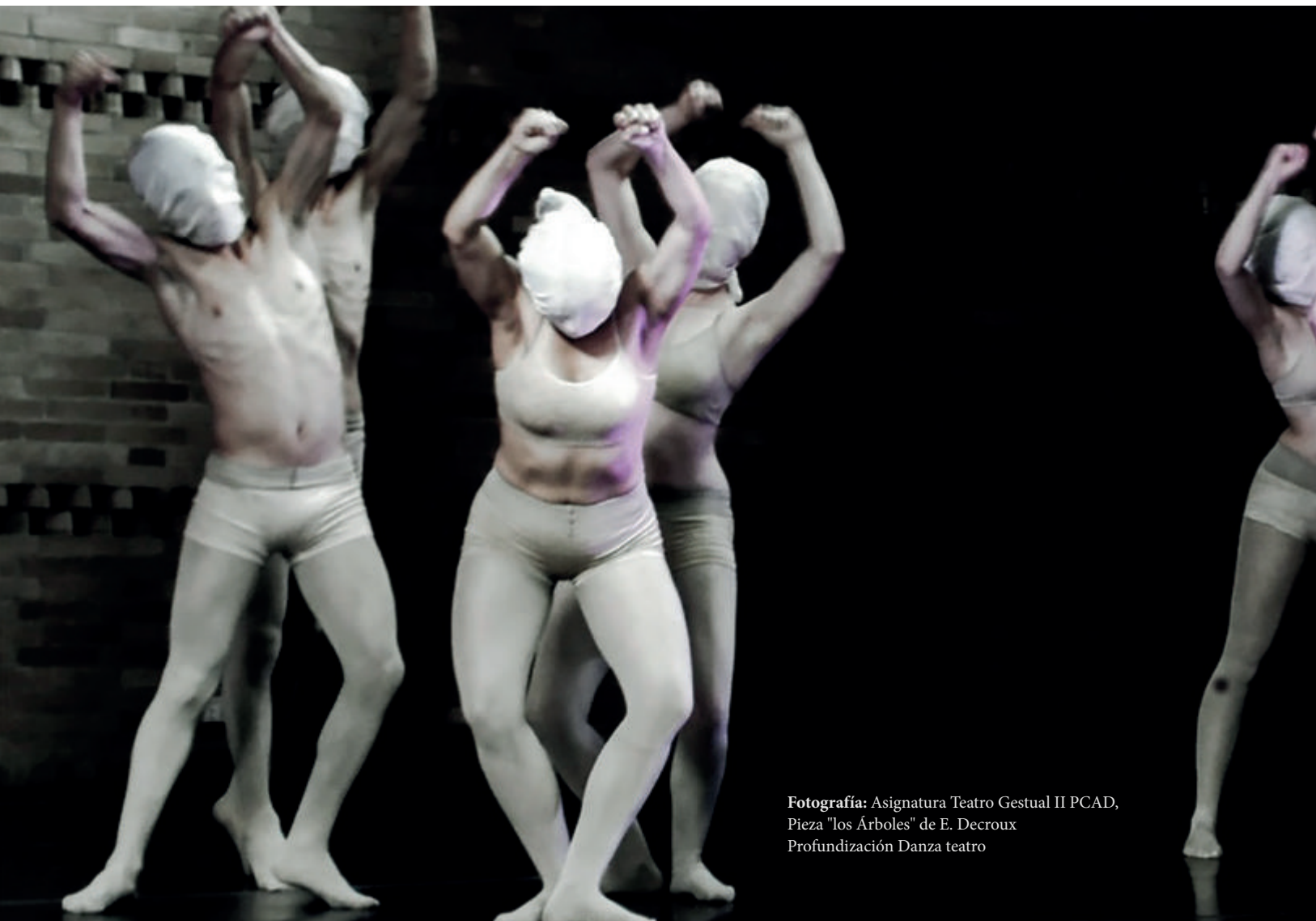
Fotografía: Asignatura Teatro Gestual II PCAD, Pieza "los Árboles" de E. Decroux Profundización Danza teatro

De la misma manera, Silveria (2013) alude a los inicios de un momento histórico de la danza en Montevideo, Uruguay, al señalar los aspectos empíricos y artísticos y caracterizar a los distintos representantes donde las estéticas, la plástica, la música, el performance se integran en el proceso creativo y de improvisación, en medio de un momento creativo que atravesaba por diversas dificultades conceptuales y de apoyo económico. Cabe preguntarse cuáles son las particularidades del cuerpo y su historia en Latinoamérica, sin perder la inmanencia del teatro (Castillo, 2011). Un programa gestual contendrá el relato del cuerpo, la presencia viva del cuerpo en ese relatarse a sí mismo; o lo que será un nuevo realismo del cuerpo en acción (Mangieri, 2010).