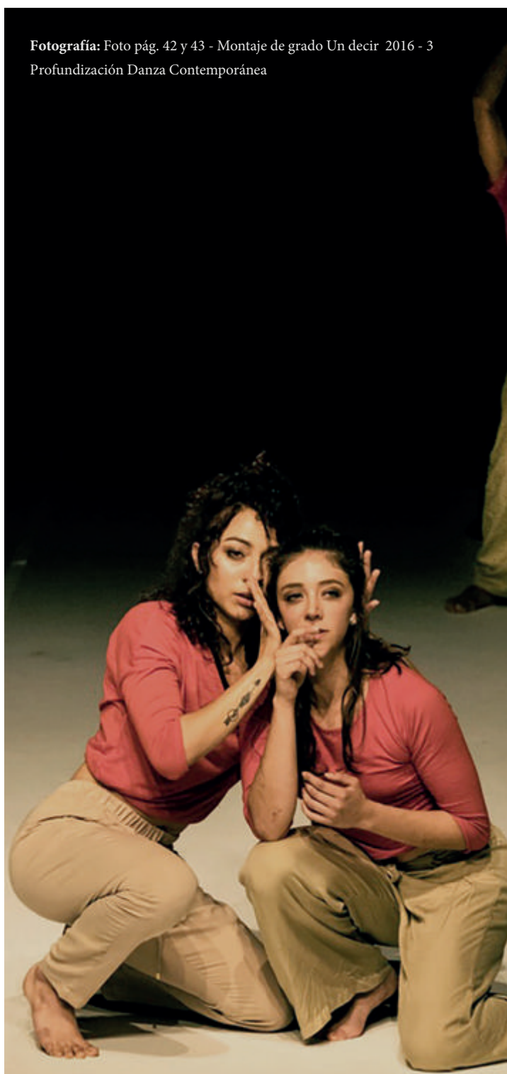
Fotografía: Foto pág. 42 y 43 - Montaje de grado Un decir 2016 - 3 Profundización Danza Contemporánea

Irmgard Bartenief y Jerzy Grotowsky, en el entrenamiento de la mente y el cuerpo para ambas disciplinas; y López (2017), quien se pregunta por la utilización de elementos de la interpretación danzaria como las acciones básicas de Laban, el trabajo de acción física de Grotowsky y las metodologías de creación de Bausch para construir el cuerpo de un personaje teatral. Por último, una visión más social y comunitaria de las prácticas en Danza teatro en “Reminiscencias de un cuerpo” para transitar por el cuerpo histórico, expresivo...” (Camargo, 2013), una inquietud por el cuerpo individual y el cuerpo social más allá de la técnica o el género danzario.