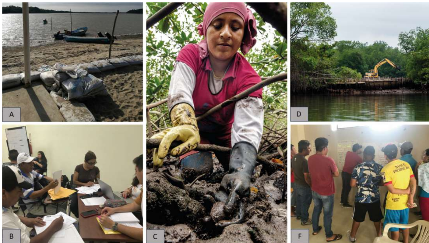
FIGURA 4. Usuarios de manglar de Jambi

A: Muro de sacos de arena autoconstruido para evitar la entra del mar y botes pesqueros artesanales. B: Docentes universitarios colaborando con beneficiarios en elaboración de informes. C: Usuaría de manglar extrayendo concha negra, imagen de Javier Vázquez. D: Preparación de terrero para piscina camaronera. F: talleres comunitarios.