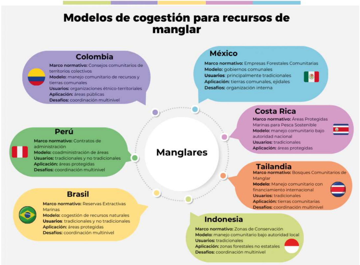
FIGURA 2. Modelos de cogobernanza para recursos de manglar en varios países.

En Colombia, existen organizaciones étnicoterritoriales, denominadas Consejos Comunitarios de Comunidades Negras, que otorgan concesiones, permisos, autorizaciones y licencias ambientales para el uso, aprovechamiento o movilización de los recursos naturales renovables según la ley (Cuesta-Rentería e Hinestroza-Cuesta, 2017). Los Consejos Comunitarios ejercen control sobre las actividades productivas en el ecosistema según el Reglamento Interno Comunitario Los Manglares 2012 [Municipio de López de Micay]. Adicionalmente, existen las Organizaciones Negras del Chocó agrupadas en federaciones departamentales llamadas