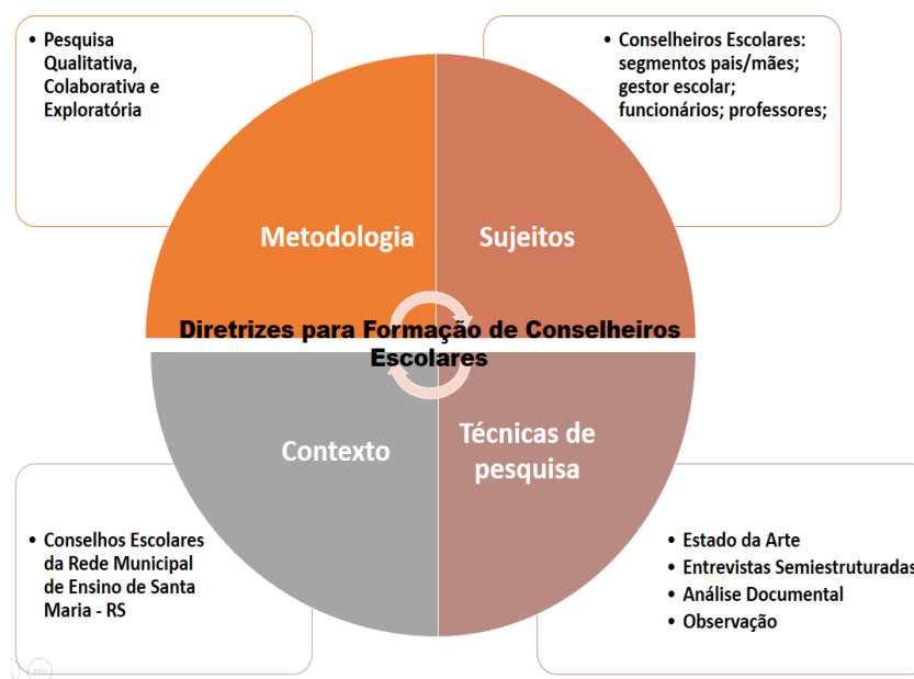
Figura 1 – Matriz metodológica da pesquisa

Os principais fundamentos teóricos e o percurso metodológico adotados na pesquisa estão delineados a seguir (Figura 1):