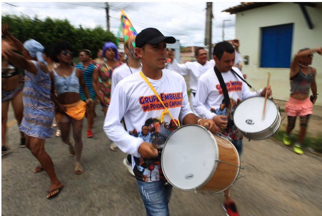
Figura 1 – O cortejo

“vai sair no Embelêco” 9 se reúne no rancho 10 , para que cada homem assuma seu personagem. Depois de prontos no rancho, os personagens e brincantes seguem em cortejo (figura 1) pelas ruas da cidade e povoados circunvizinhos, visitando residências e comércios; dançando, cantando e esperando uma contribuição em dinheiro das pessoas que assistem e interagem.