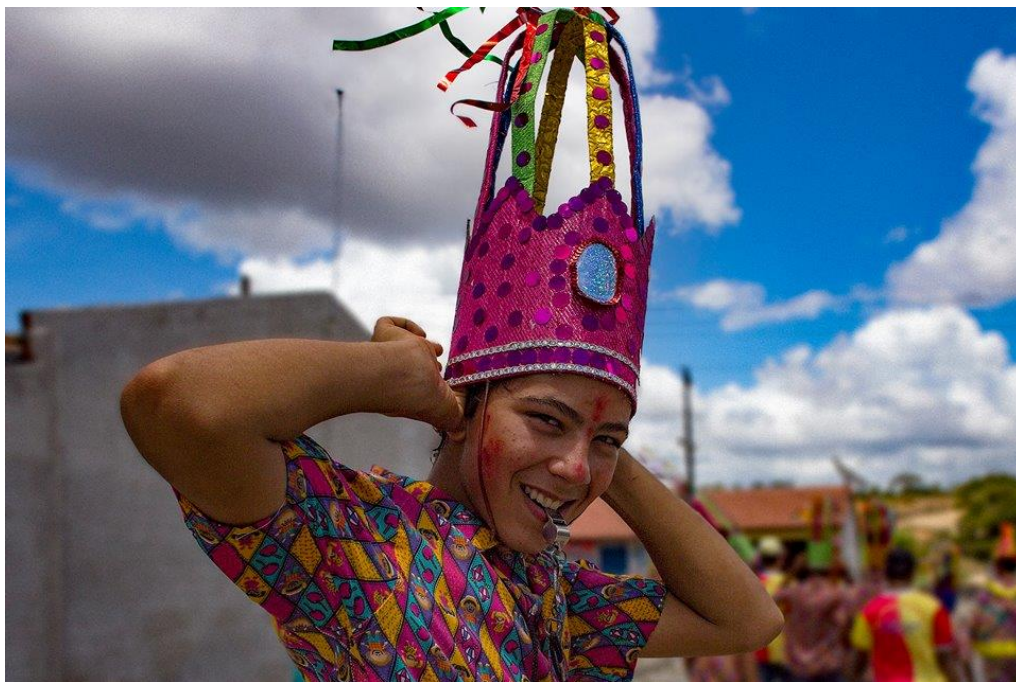
Figura 5 – O Gerente

Os gerentes (figura 5) acompanham o palhaço junto com os músicos, sua função principal é marcar o andamento da música com os apitos que carregam. O apito dos gerentes determina o andamento da música, dos versos e dos brincantes, visto que os pés, em dança, acompanham este andamento.