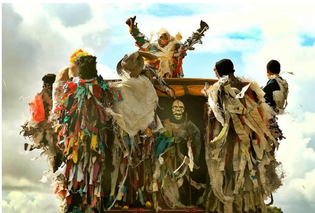
Figura 2 – Embelêcos na Mercedinha

animal abençoado, sendo o responsável por transportar Cristo para a entrada triunfal em Jerusalém, antes de sua morte. O Judas, na perspectiva dos embelêcados, não é digno de subir no animal abençoado, o jegue.