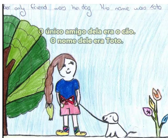
Figura 1 – Estudante do 5º projetando sua imagem para ilustrar o fragmento do conto recontado

Na Figura 1, apresentada a seguir, pode-se observar, por meio do desenho realizado por uma das estudantes, a projeção de sua imagem para ilustrar o fragmento do conto recontado.