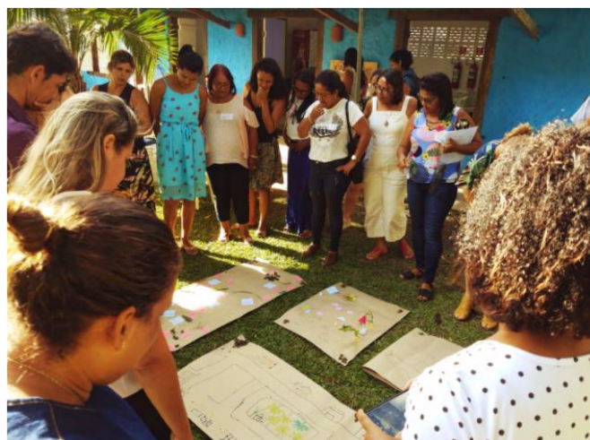
Figura 1 – Oficina com comunidade local e educadores: levantamento dos ativos da comunidade educadora e território educativo