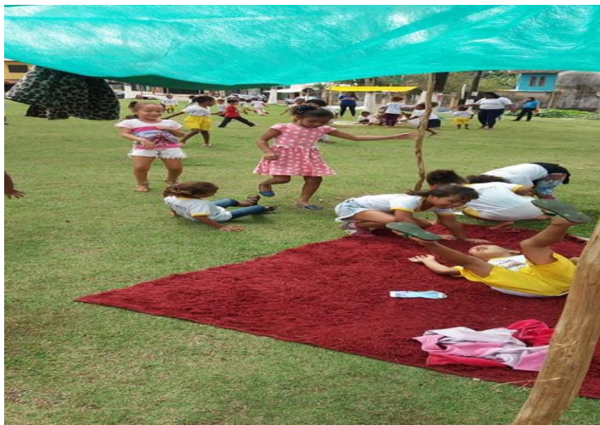
Figura 3 – Crianças da Creche Eva Santos em atividades realizadas na Praça Pedro Gomes, em Serra Grande, Uruçuca-BA

Ao discutir um projeto arquitetônico educacional, acompanhar sua execução, elaborar o PPP e dar início à organização do Conselho Escolar, essa comunidade vivencia uma ruptura com as práticas de gestão que estamos habituados e nos aproxima de ricos processos de tomada de decisão e grandes possibilidades de transformação social.