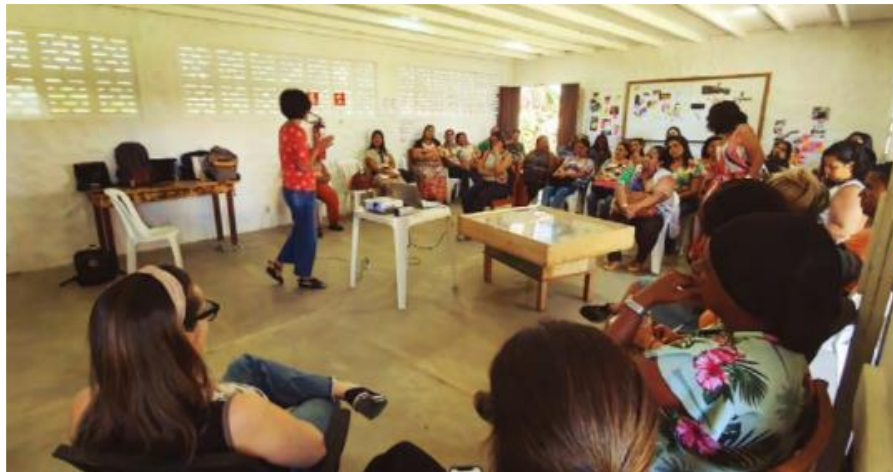
Figura 2 – Encontro de aproximações e discussões sobre Projeto Arquitetônico e PPP do CIEI de Serra Grande com a comunidade e educadores, 2019

Como resultado do exercício da gestão participativa, a experiência que temos vivenciado na Vila de Serra Grande, Uruçuca-BA, onde a educação é discutida com a comunidade local e escolar (FIGURA 2), demonstra que para além das definições e concepções acadêmicas que encontramos para os espaços educativos, aqui a arquitetura educacional dialoga com o PPP ao apresentar-se como um construto que alinha as perspectivas de território educativo, comunidade educadora e escola sustentável, como um movimento integrador da prática educativa para uma educação integral.