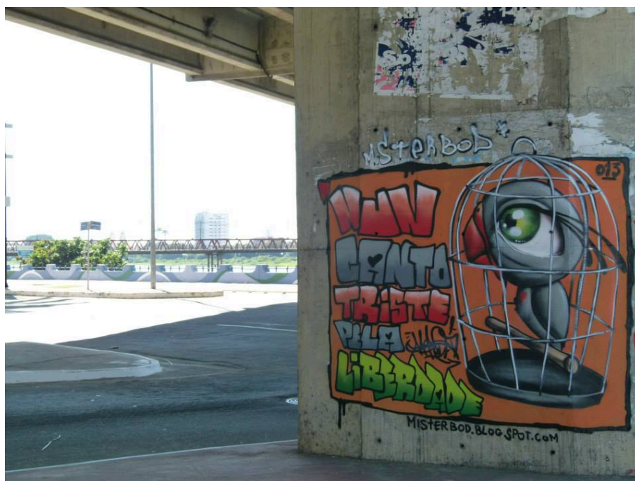
FIGURA 8. Grafite pela Cidade de Campos dos Goytacazes/RJ, 2015