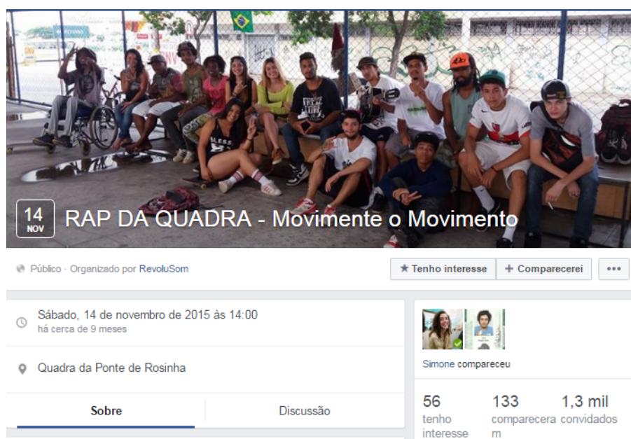
FIGURA 10. Evento no Facebook promovendo batalha de MCs em Campos dos Goytacazes, 2015

Percebemos que, depois dos eventos promovidos pelo Rima Cabrunco , outros grupos ligados ao movimento Hip-Hop começaram a se articular pela internet, principalmente no Facebook, a fim de promoverem novos episódios de batalhas de MCs na cidade (Figura 10). Diferentes grupos promovem eventos de batalhas de MCs nos mesmos lugares, na área central da cidade de Campos dos Goytacazes, como por exemplo, na quadra de esportes Hugo Oliveira Saldanha, embaixo do Viaduto da Rosinha. Esses grupos dialogam entre si e almejam eventos cada vez maiores e que tragam mais visibilidade para a cultura de rua.