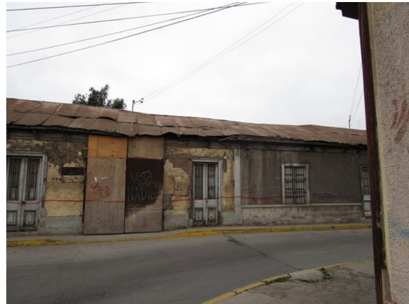
Figura 7. Casas en mal estado, habitadas por ancianas herederas

En Almagro esquina Vado de Las Ánimas, sitio actualmente cerrado con pandereta, habitó un anciano con muchos gatos. Según vecinos, se iluminaba con velas y una noche se incendió con la puerta trancada por dentro, quemándose por completo la casa, él y sus gatos. Esta es una tragedia dantesca dentro del contexto barrial, que probablemente inspira a Norma, la anciana amante de sus perros, y re significa el hecho como potente símbolo de lucha frente a la autoridad.