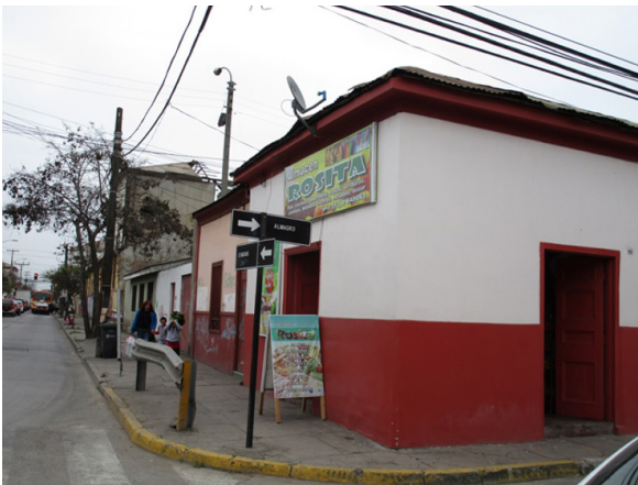
Figura 4. Almacén Rosita

Respecto a cambios cualitativos percibidos en el tiempo, una propietaria reconoce que la ciudad ha crecido de manera considerable en los últimos años por la actividad minera en el norte, y que las propiedades están a precios inalcanzables,