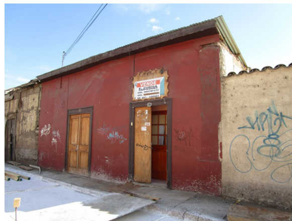
Figura 8. Almagro 746, casa en venta, con patio sobre la caja del río Elqui

Actualmente hay pocas propiedades en venta. La n.º 746 (figura 8) exhibe un viejo cartel de venta, junto a otros de comida, costura y arreglo de ropa. El patio trasero domina la caja del río con su ligera ampliación: tres piezas con baño arrendadas en 100, 120 y 140 mil pesos, respectivamente, muy demandadas por su ubicación central. La propiedad ha estado a la venta por años, en 65 millones de pesos, pero solo ha captado ofertas muy inferiores al monto deseado. Las razones las expone la dueña de la casa, “la casa es muy oscura y no se puede intervenir la fachada con ventanas o entrada para vehículo, sumado al tremendo deterioro de casas vecinas y casas abandonadas con ocupas, basurales y riesgo de derrumbe” (T. Fonseca, propietaria Almagro 746, comunicación personal, 9 de septiembre de 2015). Por eso deciden quedarse, lo que obtendrían ahora no alcanza para una propiedad en otro lugar, ni siquiera a las afueras de la ciudad.