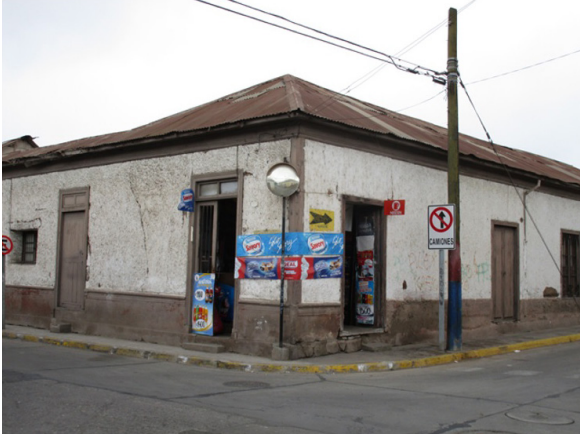
Figura 3. Almacén Rosita