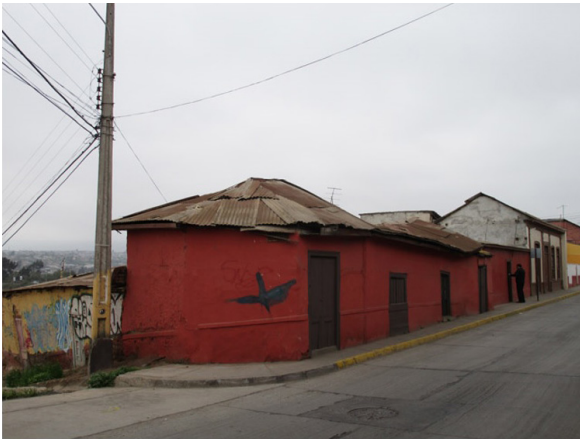
Figura 5. Casas en mal estado, habitadas por ancianas herederas Fuente: elaboración propia