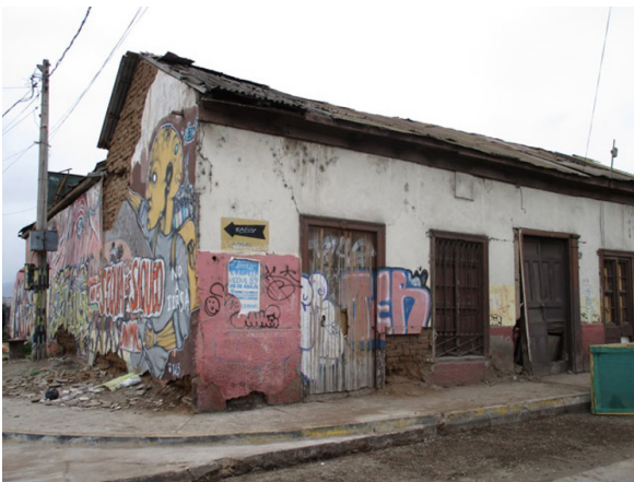
Figura 6. Casas en mal estado, habitadas por ancianas herederas