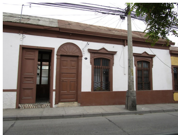
Figura 2. Almacén Rosita