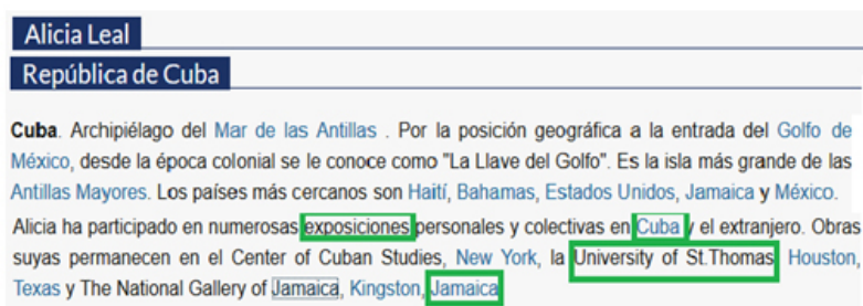
Figura 4. Documento con anotaciones semánticas

por un vector que contiene todos los conceptos con su respectivo valor. Para cada concepto se determina su índice y se almacena en el documento en el formato concepto-valor del índice.