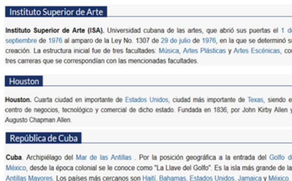
Figura 3. Identificación de los conceptos asociados a los términos

Se asigna al término un único concepto que se utiliza para realizar la anotación semántica. Las palabras del texto relacionadas con los conceptos identificados en la ontología son anotadas y se construye un índice semántico para facilitar la RI (figura 4).