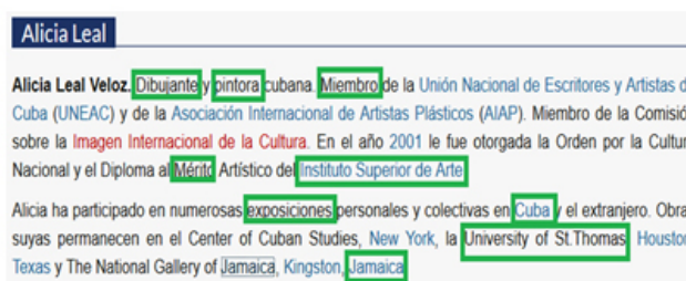
Figura 2. Identificación de los términos en un texto en lenguaje natural

El componente obtiene un documento en lenguaje natural y procede a extraer los términos mediante el algoritmo TF-IDF (Salton et al., 1983) para crear la lista de términos candidatos a convertirse en conceptos en la ontología de dominio. A la lista de términos candidatos (figura 2 y 3) se le aplica el reconocimiento de entidades nombradas, para disminuir la ambigüedad del lenguaje natural y seleccionar los conceptos que mayor significado aportan.