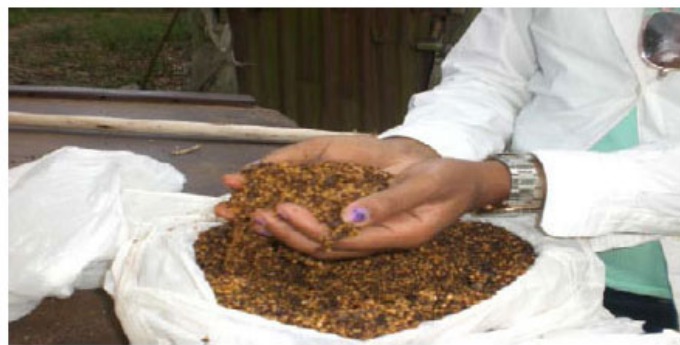
Figura 3. Rendimiento de la recolección de 50 ramas de una planta de ateje. Elaboración propia.

Se pudo constatar a través de métodos visuales y prácticos que el pienso obtenido de 50 ramas se pueden alimentar 20 gallinas criollas durante 15 días, aumentando 0,85 g por semana, mientras que 100 gallinas se pueden alimentar durante tres días con frutos de 50 ramas (Figura 3).