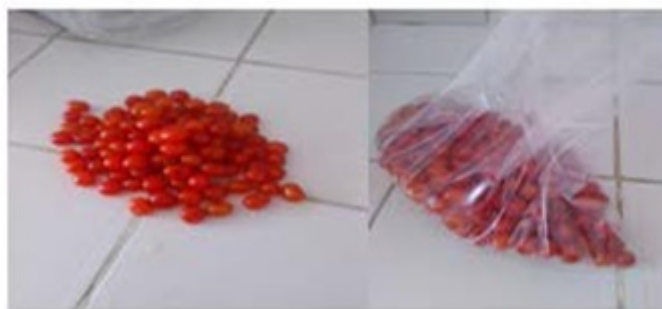
Figura 4. Muestra de 100 frutos de ateje. Elaboración propia.

La selección final de 4 frutos como se muestra en la (Figura 5) facilitó aproximarse al color final, corroborando el mismo con la carta de colores. La carta de colores es un muestrario que un fabricante realiza y nos facilita los colores que se aproximan lo más fiable posible al color final.