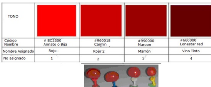
Figura 5. Color de los frutos de ateje recolectados.

En la (Figura 5) se muestra el color rojo 2 de los frutos ateje recolectados, el cual indica su índice de madurez, se percibe la madurez de forma visual, momento adecuado para proceder a su recolección (Infoagro, 2019).