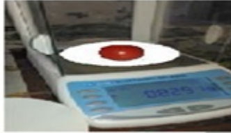
Figura 2. Peso individual al azar de frutos de ateje. Elaboración propia.

Por otro lado, resulta evidente que el fruto de ateje carece de masa como otras frutas estudiadas, por tanto el peso específico y el peso de los frutos de ateje es bajo (Figura 2). A pesar de que el fruto de ateje presenta baja densidad los resultados de esta variable nos permiten planificar la manipulación del proceso de secado y molienda del fruto deshidratado ya que la densidad está muy relacionada con el rendimiento del fruto.