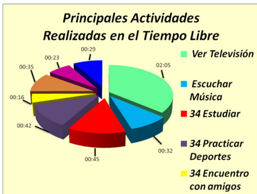
Figura 1. Estudio de presupuesto Tiempo.