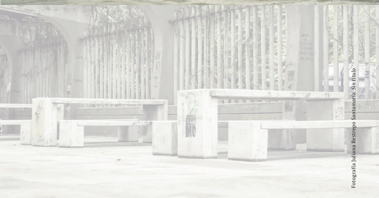
Fotografía Juliana Restrepo Santamaría. Sin título