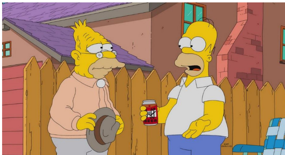
Figura 1. Escena de la serie Los Simpson donde aparece la marca Duff

Fuente: Throw Grampa from the Dane, 2018, Temporada 29, episodio 20 (Groening, 1989-presente).