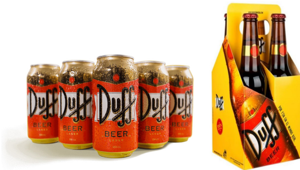
Figura 2. Cerveza Duff

En la página web no aparece ningún personaje ni se hace mención a la serie de televisión. Se conservan los colores corporativos rojo, amarillo y dorado y se certifica su oficialidad. En cambio, aunque no hay referencia explícita, el eslogan es: “Por fin en el mundo real, Duff”. Se reconoce así su carácter inverso y se asume su identificación indirecta con la serie (Figura 2).