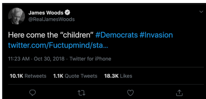
Figura 4. Trino con mayor amplificación de la cuenta @RealJamesWoods

Con la finalidad de identificar los trinos que gozaron de mayor amplificación a través de retrinos durante el periodo analizado, se contabilizaron las frecuencias con las cuales los mensajes obtuvieron retrinos. Entre los más destacados se encontraron los siguientes.