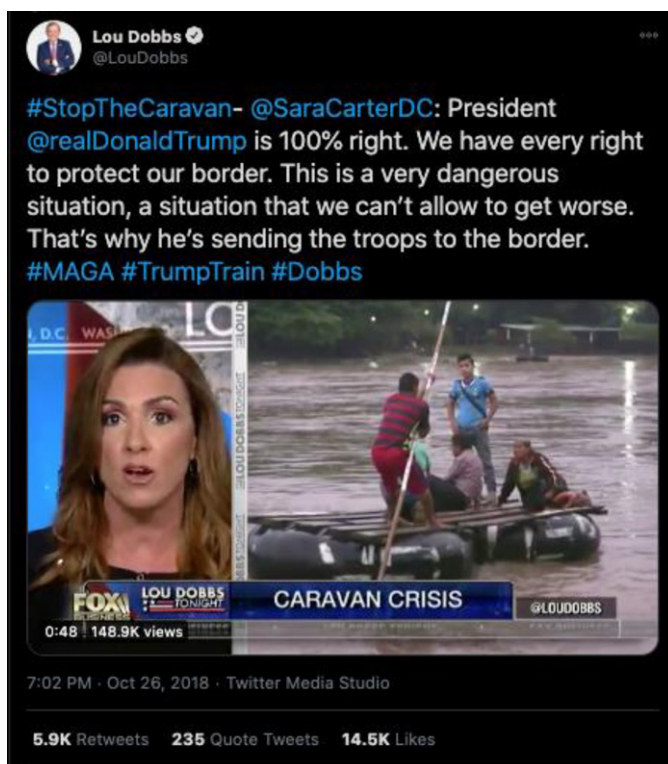
Figura 7. Trino de @LouDobbs en contra de la caravana migrante

Otro trino de impacto fue el del conductor Lou Dobbs de Fox News (Figura 7): “El presidente @realDonaldTrump está 100% correcto. Tenemos todo el derecho de proteger nuestra frontera. Esta es una situación muy peligrosa, una situación que no podemos permitir que empeore. Por eso es que están enviando tropas a la frontera [...]” (traducción propia). Este mensaje ocupó el quinto lugar en la lista de contenidos más compartidos, con 6.589 retrinos, y muestra una clara tendencia en contra de la caravana migrante, amplificado por la cuenta @AnnCarolPerry1 (bot).