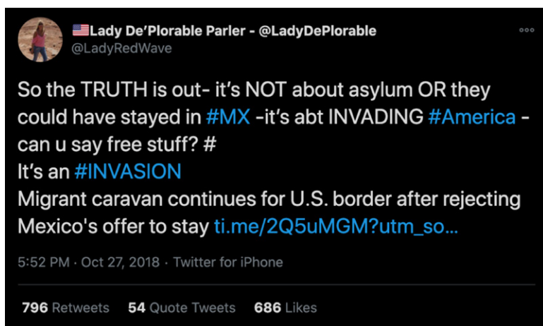
Figura 3. Cuenta @LadyRedWave identificada como bot

La caravana de migrantes continúa hacia la frontera de Estados Unidos luego de rechazar la oferta de México para quedarse [...]” (Figura 3; traducción propia).