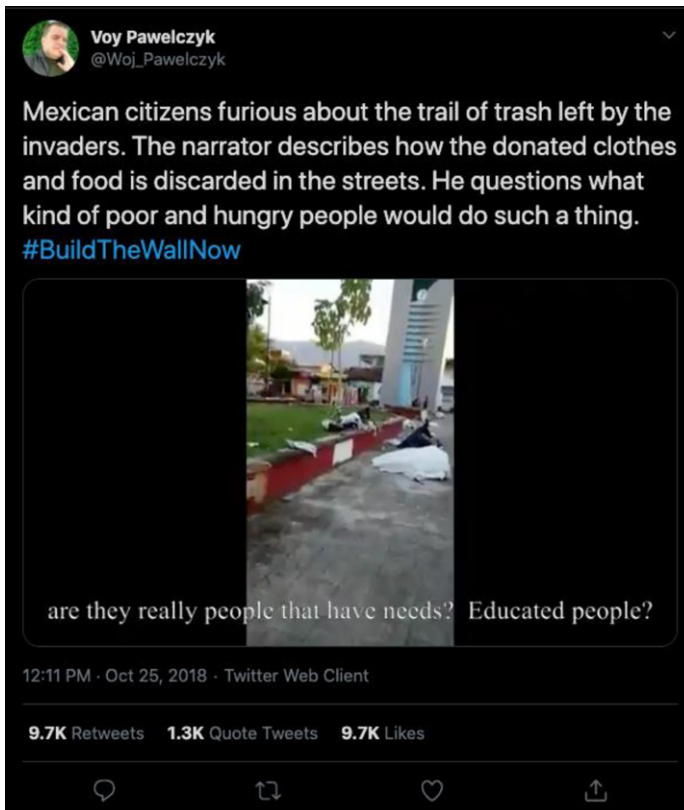
Figura 5. Trino de @PolishPatriotTM en contra de la caravana migrante

Otro trino, originalmente publicado el día 25 de octubre de 2018, a las 17:11:30, logró amplificación por las cuentas @AnnCarolPerry1 (bot) y @Jojoingnette (bot) y obtuvo 10.576 retrinos totales. El trino fue atribuido a la cuenta @PolishPatriotTM (ahora @woj_pawelczyk) con una posición evidentemente en contra de la caravana migrante. Este trino fue parte de la etiqueta #BuildTheWallNow: “Ciudadanos mexicanos furiosos por el rastro de basura que dejaron los invasores. El narrador describe cómo la ropa y alimentos donados se tiraron en la calle. Él se pregunta qué clase de gente pobre y hambrienta haría tal cosa #Contruyanelmuroahora [...] ¿Son en realidad personas que tienen necesidades?, ¿gente educada?” (traducción propia).