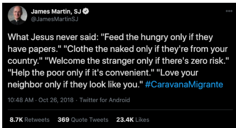
Figura 6. Trino de @JamesMartinSJ a favor de la caravana migrante

Por otra parte, James Martin SJ –padre jesuita estadounidense– se pronunciaba a favor de la caravana (Figura 6): “Lo que Jesús nunca dijo: ‘Alimenta a los hambrientos solo si tienen papeles’. ‘Viste a los que no tienen vestido solo si son de nuestro país’. ‘Dales la bienvenida a los extraños solo si representan cero riesgos’. ‘Ayuda a los pobres solo si es conveniente’. ‘Ama a tu prójimo solo si luce igual a ti [ ... ]” (traducción propia). Este fue el tercero de los mensajes con más retrinos dentro de las bases de datos con 7.851 registros totales. El trino contenía la etiqueta #CaravanaMigrante, pero no fue amplificado por ninguna de las cuentas consideradas como centrales durante el periodo de observación.