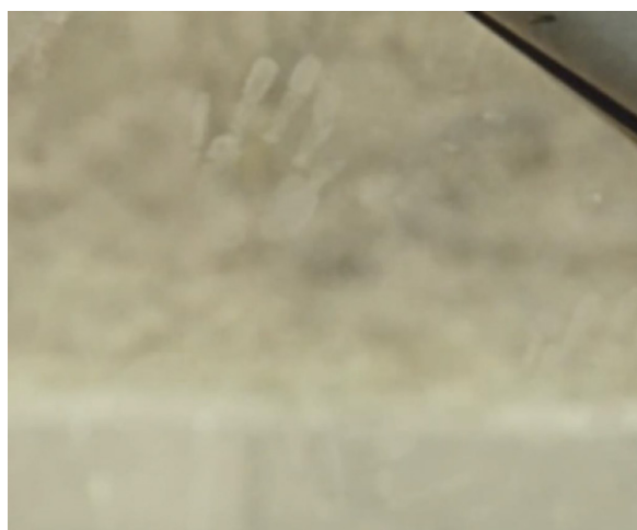
Figura 5. Plano 2, escena 3 de La mujer sin cabeza

Los encuadres son exactamente iguales, con la salvedad de que Verónica ha decidido quitarse las gafas de sol. Este hecho es relevante, pues parecería que la escena ha sido rodada en continuidad y que, a posteriori, ha sido montada con los otros dos planos frontales (delanteros y traseros) de la carretera (planos 1 y 3). Sin embargo, se destaca el siguiente detalle: las huellas en ambos encuadres son diferentes. Diferencia palmaria desde el momento en que ambas están enmarcadas por un mismo encuadre con poca profundidad de campo.