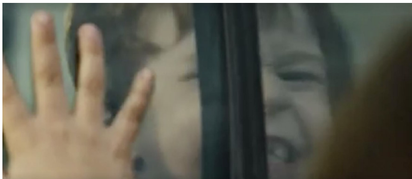
Figura 2. Plano 4, escena 2 de La mujer sin cabeza

16 y 18), junto al tintineo de las llaves (plano 17) o los manotazos sobre la ventanilla donde veremos las huellas.