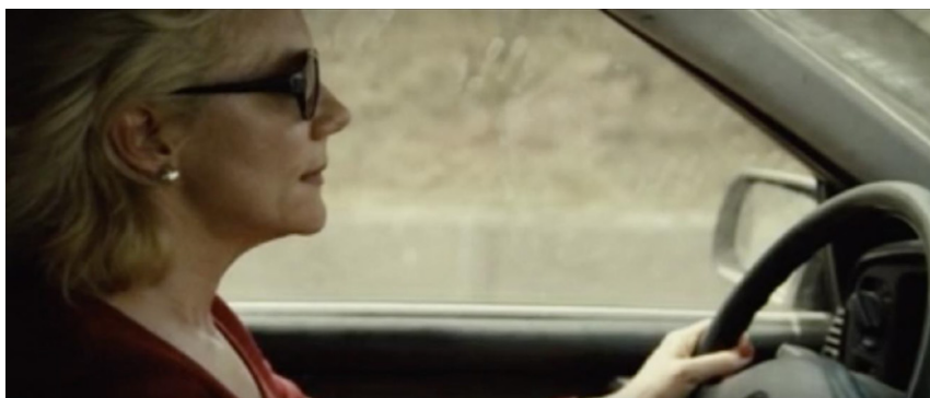
Figura 3. Plano 2, escena 3 de La mujer sin cabeza

La hipótesis anteriormente expuesta defiende que un fallo de récord en la escena del accidente invita al espectador a significar las huellas en la ventanilla del coche de Verónica como índices del cuerpo del desaparecido. Ahora bien, en qué momento y de qué forma se produce ese error de continuidad y cómo afecta al conjunto del texto fílmico. Los planos 2 y 4 de la escena “el accidente” repiten encuadre: perfil derecho de Verónica en primer plano enmarcado por la ventanilla lateral izquierda del vehículo. Ambos planos objetivos y fijos nos muestran las huellas casi en el centro de la imagen, decíamos, ligeramente desenfocadas.