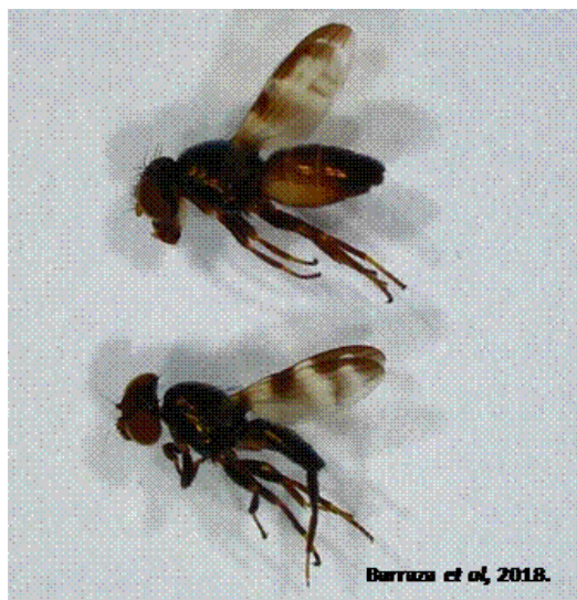
Figura 2. Euxesta annonae colectada durante la investigación