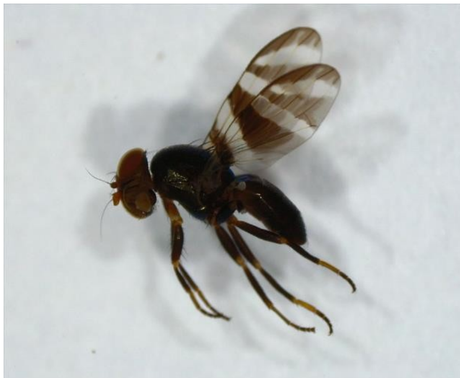
Figura 1. Euxesta mazorca colectada durante la investigación

Especies de Euxesta spp encontradas por provincia y localidad