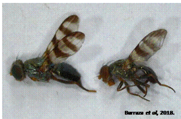
Figura 3. Euxesta stigmatias colectada durante la investigación.