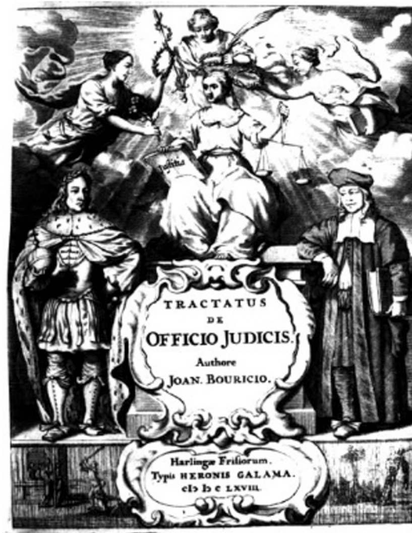
Fig. 10. Bouricius, Joannes, Tractatus de Officio Judicis (frontispicio), 1668.

virtud la que se corona, ya que la Prudencia también suele aparecer coronada e incluso, en alguna ocasión, las cuatro virtudes cardinales.