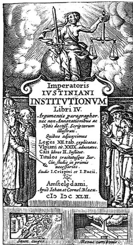
Fig. 8. Crispinus, Johan. I y Blaeu, Cornel., Justiniani Institutionum (frontispicio), 1642.

Tanto en la obra de Vouet como en la mayoría de visualizaciones, la Justicia suele aparecer coronada, o bien con una corona de oro o con una de laurel, ya que esta virtud debe reinar en el mundo, idea que se encuentra ya en la Edad Media y fue continuada en la Edad Moderna. En el Tríptico de la Justicia de Jacobello del Fiore (1421, Venecia, Gallerie dell'Accademia) la virtud aparece con una corona de oro, igual que la encontramos en la Burrell Collection de Glasgow o como Peter de Witte (s. XVI, Coll. Fondazione Giorgio cini Instituto di storia dell'Arte) la representó. Asimismo, en la Sancta Iusticia de Durero (1521, Colección particular) la justicia se visualiza como un ángel alado y coronada como la “reina de las Virtudes” (Huygebaert y Martyn 2016, 179). Así