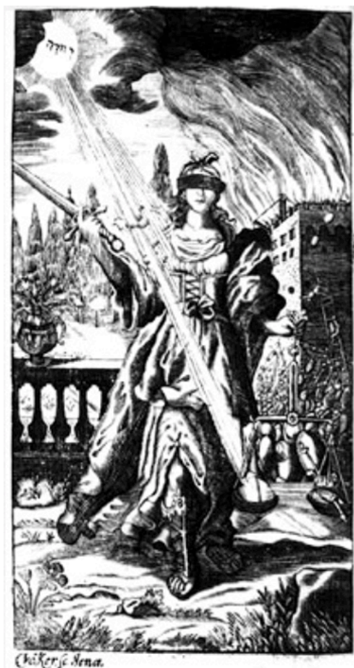
Fig. 4. Johannes Meyer y Hugo Grotius, Alegoría de la Justicia divina , Questiones Redacti de iure Belli ac Pacis des Kriegesund des Friedens... , 1688. Fig. 5. Gaucher, Charles-Étienne, “Justice”, Iconologie par figures , 1791, Latré graveur, París.

en “ A supremo dirigatur ” [“Andará bien, si se rige por Dios”], donde explica que “por muy bueno, que parezca el gobierno, sino seguiere al Sol de Justicia, que es nuestro Dios, y a su Ley, y mandamientos, de ningún provecho será” (Borja 1680, II, 398-399). Igualmente, Covarrubias, en el emblema “ Dum lucet ” [“Mientras luce”] representó un reloj de sol queriendo significar que “en aquesta vida, el que desecha / la santa inspiración, y no se guía / por el Sol verdadero de justicia / dexarle há a la sombra su malicia” (Covarrubias 1610, III, emb 74, fol. 274r). En una pintura de Nicolás Rodríguez Juárez, con título Sol iustitiae (s. XVIII, México, Parroquia de Santa María de Ozumbilla) 32 , vemos cómo esta virtud se representa mediante un gran sol sobre unas alas que sostienen dos grandes ojos. Asimismo, en uno de los jeroglíficos de las exequias de Carlos II en la catedral de Méjico (1701) vemos en la estampa al rey y al sol, destacando la inspiración divina de dicho gobernante en cuanto a la impartición de justicia, tal y como se puede leer en el texto que acompaña a la imagen 33 .