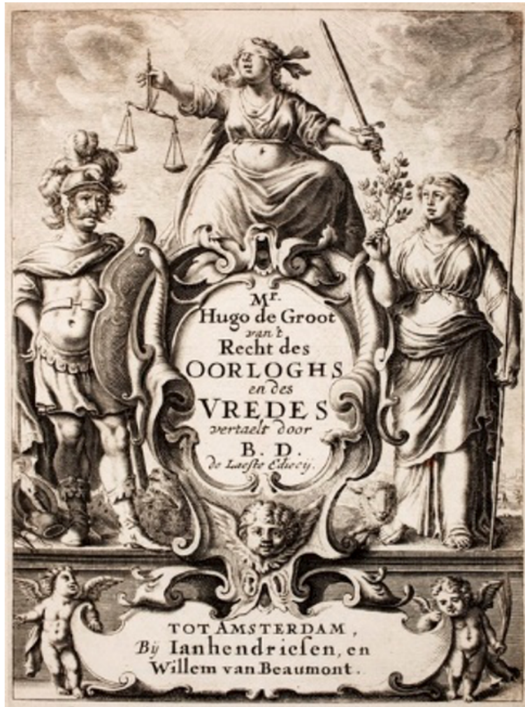
Fig. 3. de Groot, Hugo, Drie boecken van 't recht des oorloghs en vredes (frontispicio), 1657, Ámsterdam.